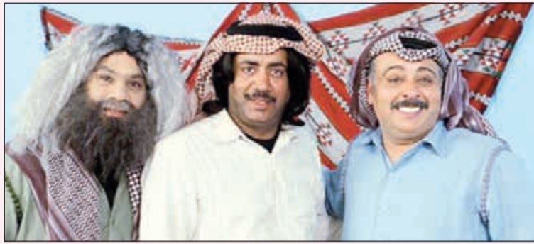
العنوان في سيل وهيل

وتطرق العنوان لمشاركته في مسلسل «الطيران» من تأليف براك الحربي وإخراج محمد الفرج وإنتاج عادل الجبني وبطولة عبدالرحمن العقل، فخرية خميس، إيمان السيد، طيف، نصر حماد، عبدالعزيز النصار، خالد مظفر، آلاء الهندي، غدير زايد، مشعل العيدان، وقال: العمل مزيج بين التراجيديا والكوميديا وخلطة جديدة بالساحة الفنية، وشخصيتي فيه ستكون غير عن السابق، كاشفاً عن مشاركته أيضاً في مسلسل محمد دحام الشمري الجديد والذي يجري تصويره حالياً في منطقة صبحان، وادرف: عمل دحام مفاجأة وستتعرف الجمهور على تفاصيله قريباً.