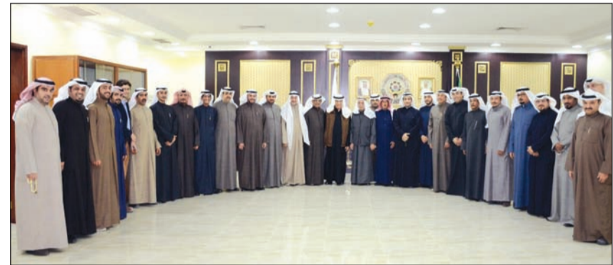
جانب من الحضور في ندوة مؤسسو الحركة النقابية الكويتية.. نصف قرن من التاريخ (عادل سلامة)