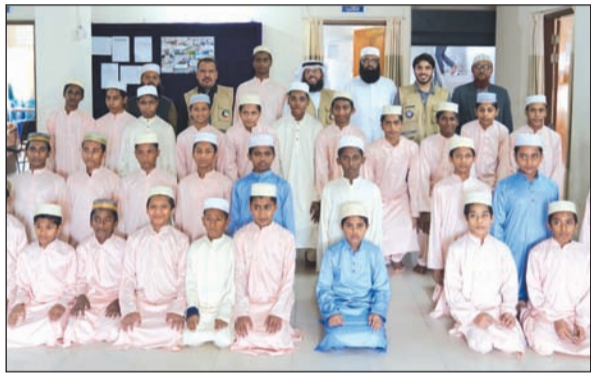
وفد «النجاة الخيرية» وطلاب المعهد