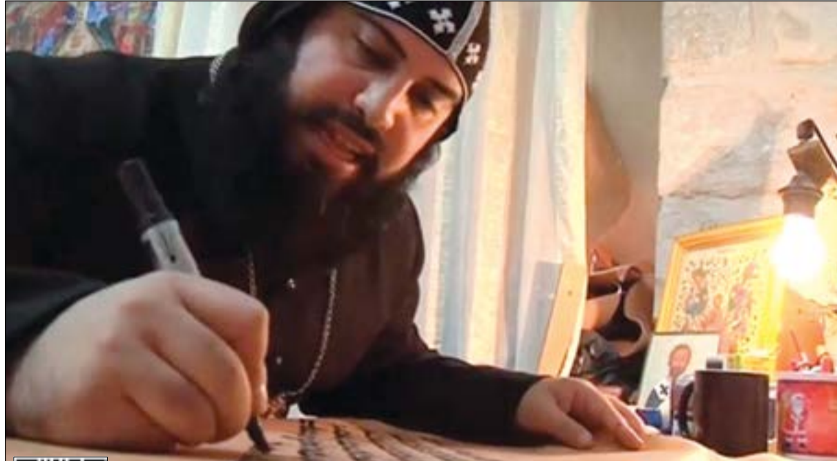
الراهب يستخدم فن الخط في الكتابة على قطع من الجلد مبدعا روائع فنية يمكن عرضها في بيوت وأماكن أخرى

يمكن استخدام QR كود أو يمكن مشاهدة الفيديو