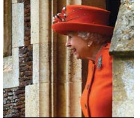
الملكة إليزابيث لدى مغادرتها كنيسة مريم المجدلية في ساندرينغهام

روبيرت: أعربت الملكة إليزابيث الثانية عن تقديرها لزوجها الأمير فيليب في رسالة عيد الميلاد وأثنت على «دعوه وروح الدعابة الفريدة» التي يتمتع بها. ورافق الأمير فيليب (96 عاما)، الملقب بدوق إدنبره، زوجته طوال جلوسها على العرش قبل 65 عاما. واثما ما كان يتصدر عناوين الأخبار بسبب تعليقاته الخارجة عن السياق. واعتزل الأمير فيليب الواجبات الملكية المعتادة في صيف هذا العام لكنه لا يزال يظهر في بعض المناسبات كان أحدثها سيره للمشاركة في قداس عيد الميلاد في ضيقه ساندرينغهام الملكية.