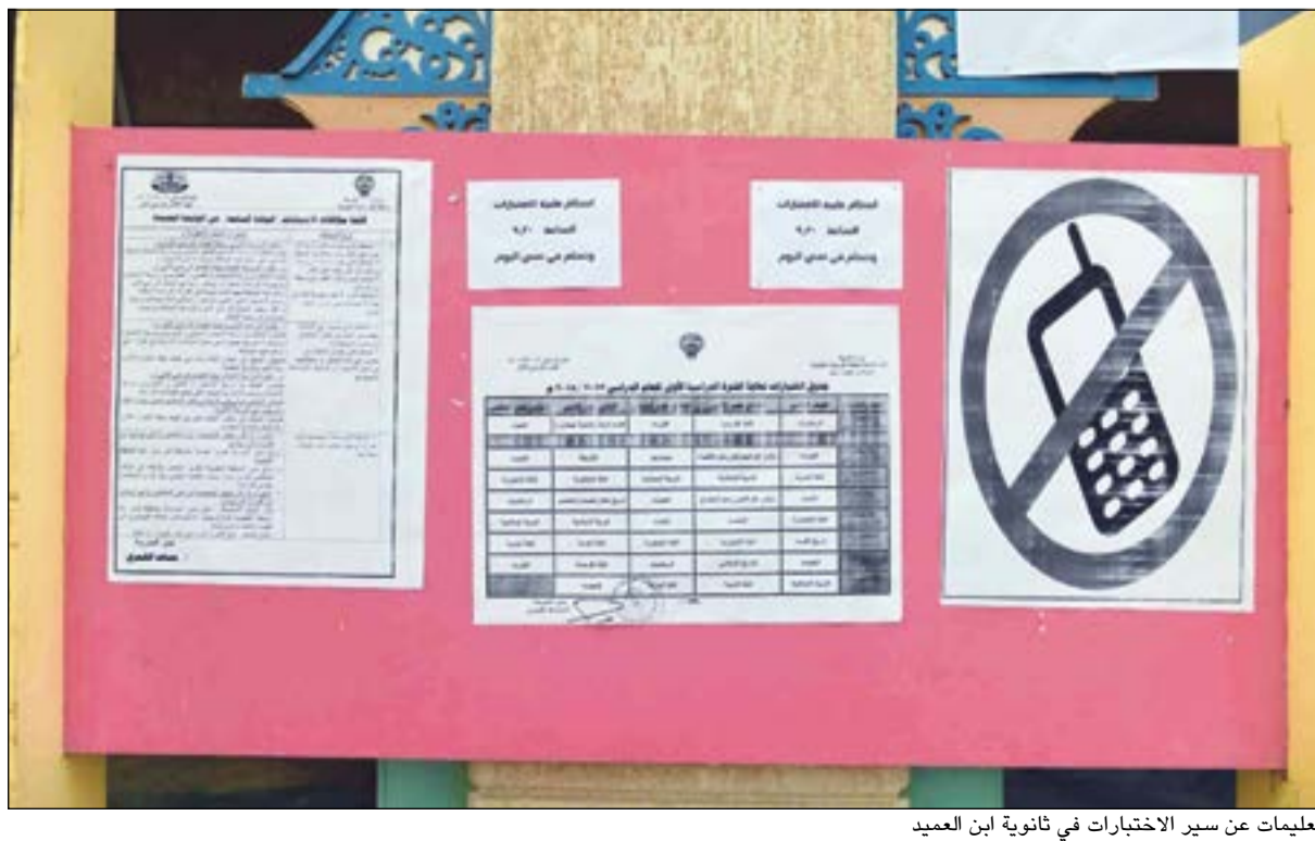
تعليمات عن سير الاختبارات في ثانوية ابن العميد