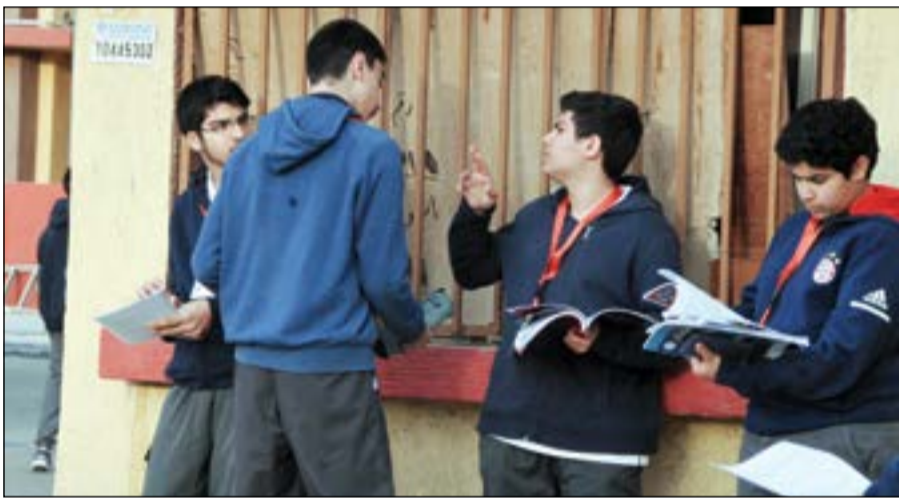
طلاب ثانوية أحمد البشر الرومي حرصوا على مراجعة أجزاء من المنهج قبل الدخول إلى اللجنة