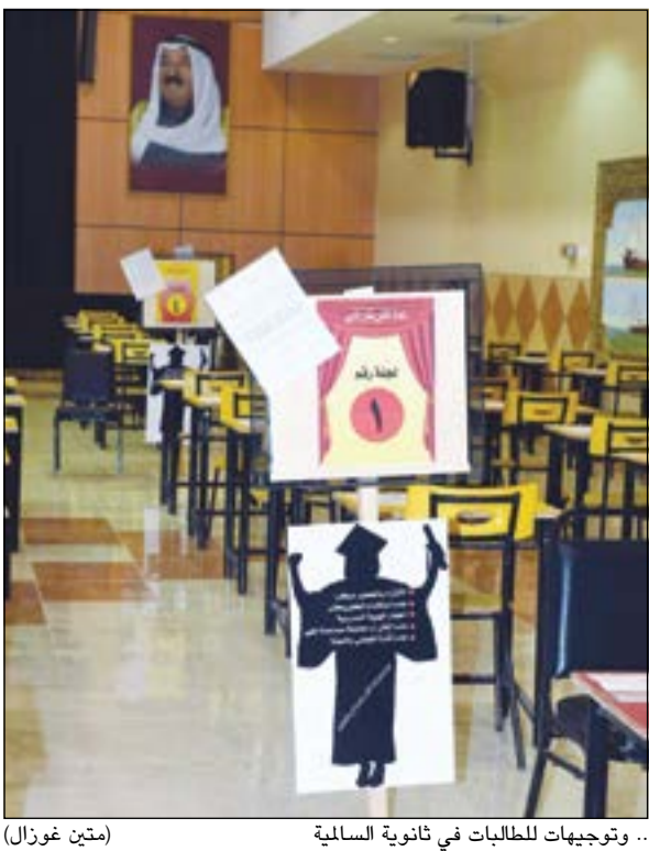
وتوجيهات للطالبات في ثانوية السالمية