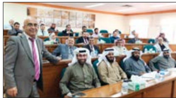
موظفو «النجاة الخيرية»، خلال المحاضرة

من جانبه، أشاد مستشار التدريب بالمعهد العربي للتخطيط د.عوني الرشود بعمل النجاة الخيرية المؤسسي، والذي تطمح من خلاله إلى تطبيق أفضل المعايير في وضع وتطبيق الاستراتيجيات. وعرف الرشود التخطيط بأنه مجموعة من القرارات المدروسة من قبل الإدارة العليا لتوجيه الموارد المتاحة نحو تحقيق الأهداف من خلال الكفاءات الفاعلة، مؤكدا أن المؤسسات الناجحة هي التي تستثمر الموارد البشرية بالشكل الأمثل بأسلوب علمي ينظم العمل بالإمكانيات المتاحة.