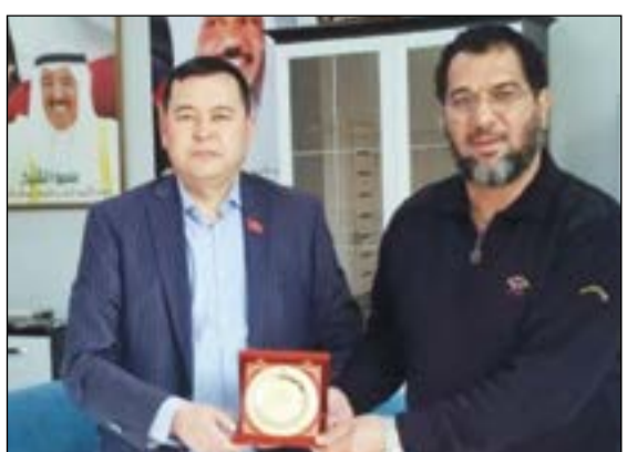
ميرلان باكجروف مكرما د.نبيل العون

شكر نائب رئيس البرلمان في الجمهورية القرغيزية ميرلان باكجروف جمعية السلام للأعمال الإنسانية والخيرية على الجهود الكبيرة التي تقوم بها في مجال الخدمة الإنسانية والخيرية داخل بلاده وللمك الكبير من الأنشطة والبرامج والمشاريع المفيدة والقيمة التي تنفذها الجمعية للشعب القرغيزي، جاء ذلك أثناء زيارة له لمقر الجمعية في قرغيزيا.