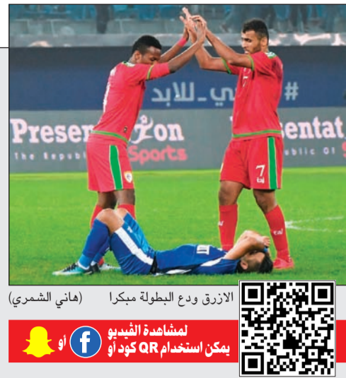
الأزرق ودع البطولة مبكراً (هاني الشمري)