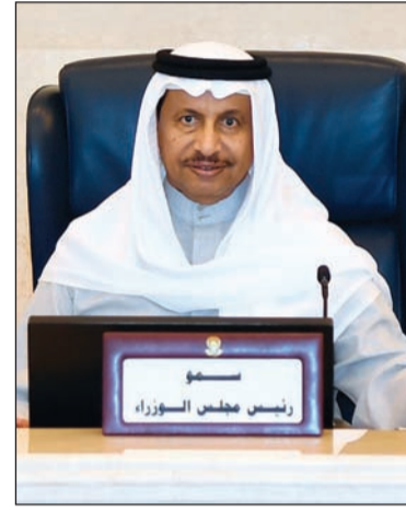
سمو رئيس الوزراء الشيخ جابر المبارك

وزير الدفاع: الكويت والسعودية متفتتان في الرؤية المستقبلية «2035» و«2030» ناصر صباح الأحمد قلّد كوكبة من الضباط الجدد ربهم الجديدة وبحث مع السفير الأميركي القضايا المشتركة 06