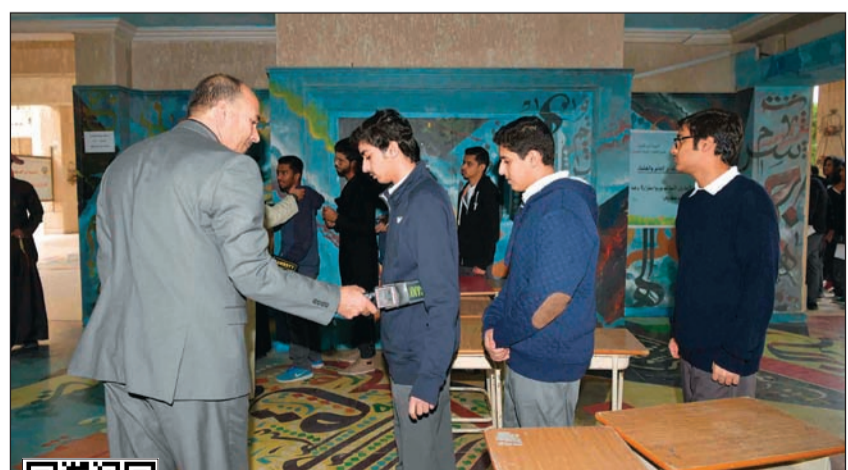
إجراءات تقنيّة للتغلب على ظاهرة الغش بالأجهزة الحديثة في ثانوية ابن العميد (لقسم باشا)

مع انطلاق اختبارات المرحلة الثانوية يوم أمس، ورغم تأكيد عدد من مسؤولي «التربية» أن الاختبارات جاءت بمستوى التحصيل الدراسي وراعت الفروق الفردية بين المتعلمين، إلا أن ردود فعل الطلبة والطالبات جاءت متفاوتة، حيث اشتكى عدد من طلبة وطالبات الصف الثاني عشر في القسم العلمي من اختبار مادة الأحياء، بينما أعرب طلاب القسم الأدبي عن ارتياحهم لمستوى أسئلة الجغرافيا. وزير التربية وزير التعليم العالي د.حامد العازمي قام بجولة تفقدية على لجان الاختبارات في عدد من المدارس صباح أمس برفقة الوكيل المساعد للتعليم العام فاطمة الكندري، أوضح بعدها أنه تم الإيعاز لمسؤولي الوزارة والمناطق التعليمية بالمتابعة اليومية خلال فترة الاختبارات للتأكد من تحقيق التوجيهات