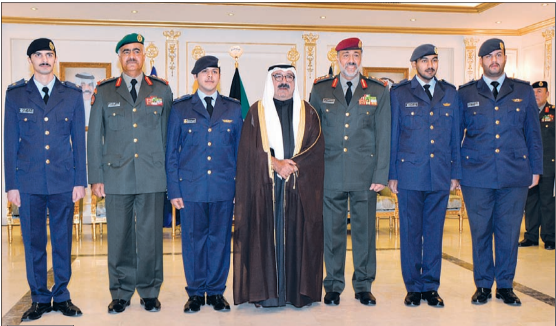
الشيخ ناصر صباح الاحمد والفريق الركن محمد الخضر والفريق الركن الشيخ عبدالله النواف مع الضباط المرقيين

مجلس الوزراء اعتمد الأحد المقبل يوم راحة والدوام 2 يناير