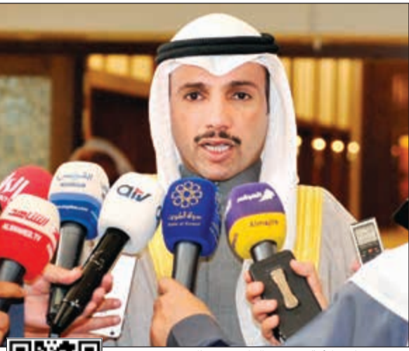
رئيس مجلس الأمة مرزوق الغانم يتحدث

وجيوش المتطوعين والمتطوعات الكويتيين الذين عملوا بصمت وخلال أيام قليلة قبل انطلاق البطولة من أجل إنجاز التظاهرة الخليجية وإدخال البهجة في نفوس الكويتيين وأهل الخليج كافة. وأضاف: «إننا نشكر في الوقت نفسه كل من عمل على رفع الإيقاف الرياضي الجائر ليتحقق هذا الحلم بإقامة البطولة على أرض الكويت، وأيضاً بصاحب السمو الأمير الذي كان المحرك الرئيسي والداعم والمساند لكل تحركات رفع الإيقاف وإلى سمو ولي العهد الذي كانت توجيهاته السيدة داعماً لجهود رفع الإيقاف الظالم دون المساس بدستور وكرامة الكويتيين». وأضاف: «كما أشكر الحكومة وخصوصاً الوزير خالد الروضان الذي كان