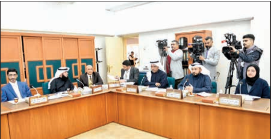
الشيخ دباس الصباح وركانه وزارته اثناء الاجتماع

النيابية والمشروع الحكومية مجتمعة. ولفت إلى أن اللجنة أحالت إلى لجنة ذوي الاحتياجات الخاصة 8 اقتراحات بقوانين تتعلق بذوي الاحتياجات الخاصة، وذلك للاختصاص.