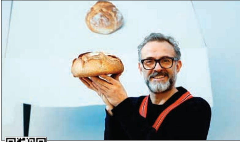
الطاهي الإيطالي الشهير ماسيمو بوتورا

رويترز: يعزز الطاهي الإيطالي الشهير ماسيمو بوتورا، الحاصل على نجومات ميشلان الثلاث، فتح مطعمين جديدين في العام القادم في إطار سلسلة مطاعم جديدة سيكون أحدهما في باريس والآخر في نابولي لكن ليس للأغنياء.