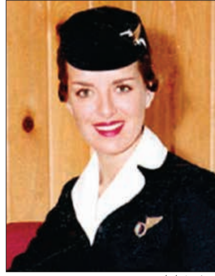
.. وفي شبابه