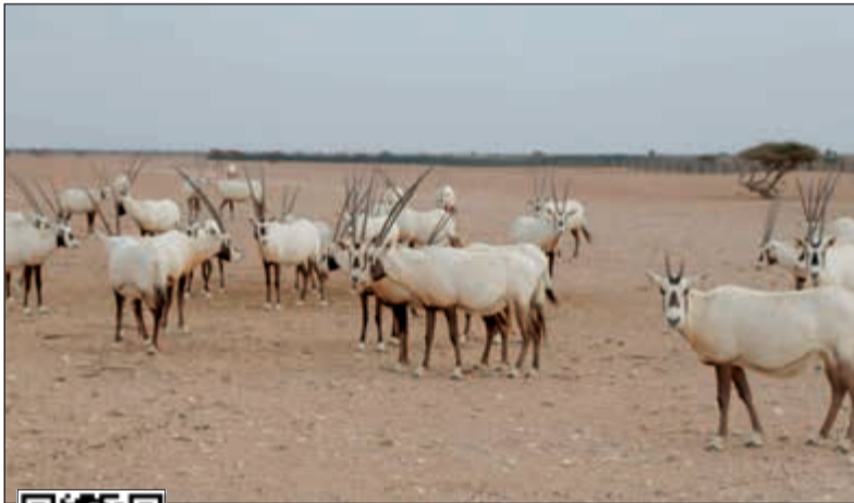
عد من الحيوانات في المحمية

فوق أرض ترابية، وخلف سياج حديدي يمتد على طول حدود محمية الكائنات الحية والغريبة التي افتتحت للمرة الأولى أمام الجمهور، تسير المها البيضاء وحيوانات أخرى في مجموعات بين الشجيرات المتنوعة، بينما يقوم اخصائون بدوريات مراقبة في سيارات دفع رباعي. وتمتد المحمية على مساحة 2824 كيلومترا مربعا، وتضم سهولا منخفضة وكثبانا رملية وتلالا مرتفعة ومنحدرات صخرية، ويوجد فيها 12 نوعا من الأشجار، بينها أشجار الغاف والسمر والسلم توفر موطنا للطيور. وتنعكس خطوة فتح ابواب المحمية امام الزوار للمرة الأولى في تاريخها رغبة السلطات في تنشيط السياحة في خضم سعي السلطة إلى تقليل الاعتماد على النفط وتنويع الإيرادات