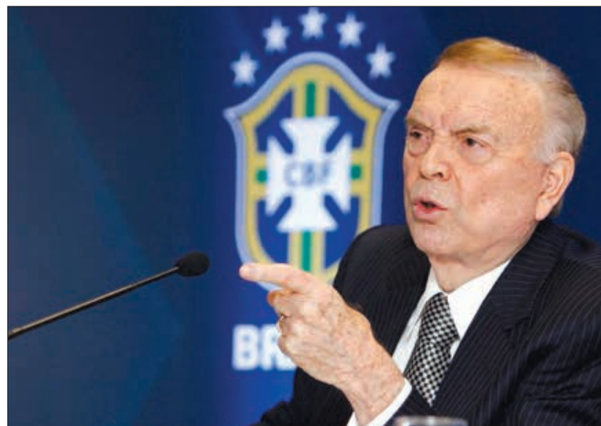
هيئة المحلفين الأميركية أدانت الرئيس السابق لاتحاد البرازيلي لكرة القدم خوسيه ماريان

وتصدر القاضية بامبلا تشين حكمها في الأسابيع القليلة المقبلة. إلا أن اللجنة المكونة من 12 عضوا لم تتوصل إلى توافق في الرأي بخصوص الرئيس السابق لاتحاد بيرو مانويل بورغا الذي وجهت إليه تهمة واحدة تتعلق بالابتزاز، وستعود إلى استئناف المداولات الثلاثة بعد عطلة عيد الميلاد.