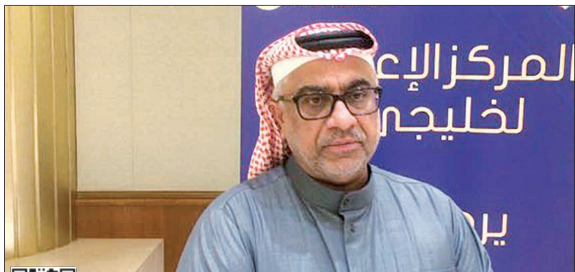
الإعلامي الإماراتي محمد الجوكر