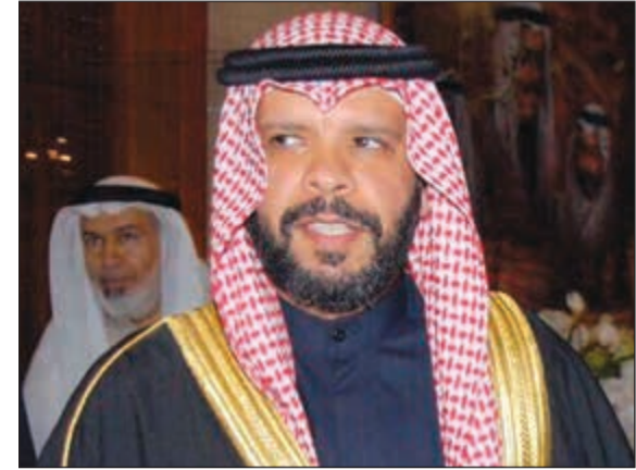
الشيخ فواز مشعل الجراح

التي تعرض لها أمام شقيقه السعودي، حيث أن الجميع يعلم أن منتخبنا الوطني عانى من الإيقاف لمدة عامين حرمته من المشاركة الدولية