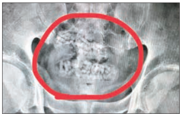
صورة الأشعة تكشف عن اجسام غريبة