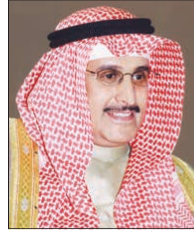
الشيخ د. إبراهيم الدعيح

يضع المؤلف هذا الكتاب بين يدي القارئ بغير اللغة العربية شارحاً وجهات نظره فيما يتعلق بإيضاح المفاهيم الصحيحة للدين الإسلامي الحنيف أملاً أن يساهم هذا الكتاب في تغيير نظرة الغرب والعالم إلى الإسلام والحضارة الإسلامية التي شابهها الكثير من سوء الفهم واللغظ جراء ما تقوم به الجماعات المتطرفة من أعمال لا تنتهي إلى جوهر الإسلام.