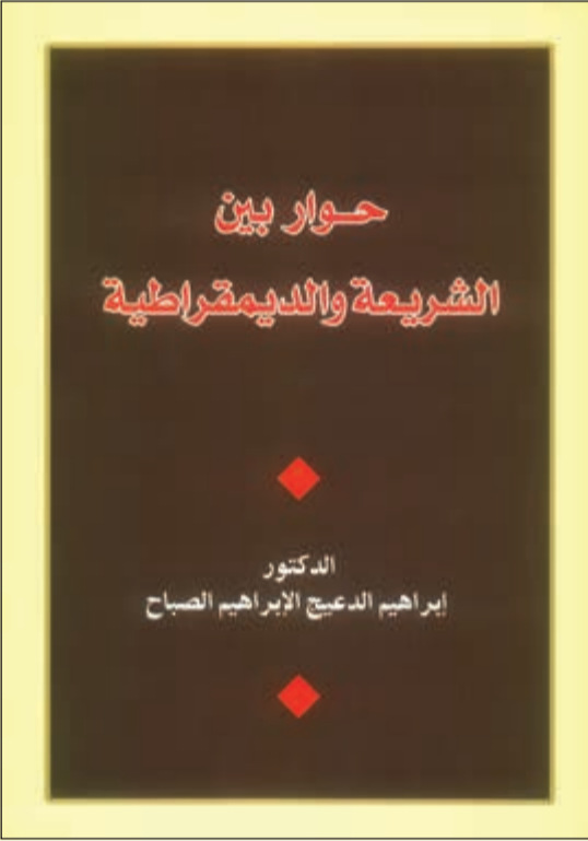
... وغلاف كتاب «حوار بين الشريعة والديمقراطية»

المؤلف تناول موضوع الشريعة والدستور من عدة جهات نظر كويتية وقضية الشريعة وحقوق المرأة