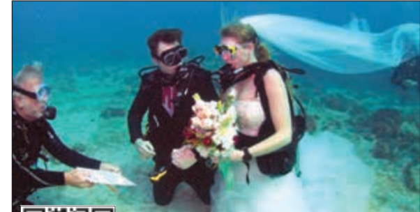
الزوجان يتبادلان العهود تحت الماء