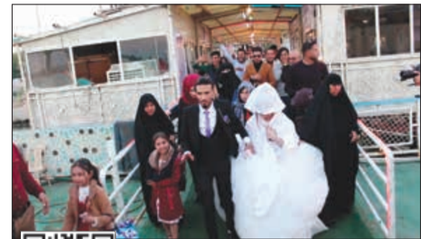
العروسان والحضور لدى توجههم إلى الزوارق