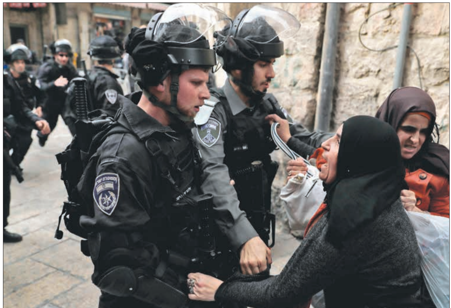
سيدة فلسطينية تُعنف عناصر من قوات الاحتلال في البلدة القديمة بالقدس امس

أبرزها على المدخل الشمالي لمدينة بيت لحم، ووسط مدينة الخليل، وعلى حاجز قلنديا الفاصل بين رام الله والقدس، وأخرى في بلدات بلعين ونعلين والنبي صالح وبدرس بمحافظة رام الله، وعلى مدخل مدينتي رام الله والبيرة. واعتقل الجيش الإسرائيلي فلسطينياً مصاباً من داخل مركبة إسعاف خلال المواجهات في رام الله. واعتقلت قوات الاحتلال الشاب المصاب من داخل عربة الإسعاف بعد الاعتداء على طواقم الإسعاف وإصابة أحد المسعفين بالرصاص المعدني في رأسه بالإضافة إلى إصابة الصحافيين بالاختناق جراء إلقاء قنابل الغاز المسيل للدموع على المتظاهرين. أما في مدينة القدس، فقد اعتدت الشرطة الإسرائيلية، على فلسطينيين بينهم صحافيين خلال تفريق تظاهرة احتجاجية، حيث تظاهر مئات الفلسطينيين في باحات المسجد الأقصى المبارك. كما قمععت شرطة الاحتلال مظهارة في شارع الواد داخل أسوار البلدة القديمة في القدس ومنعت وصولها إلى باب العامود. وفي غزة، أعلنت وزارة الصحة استشهاد الشاب زكريا الكفارنة (24 عاماً) إثر إطلاق نار في الصدر، خلال مشاركته في المواجهات، شرق بلدة جبالياً، شمالي القطاع، وفي وقت لاحق أعلن عن استشهاد فلسطيني ثان.