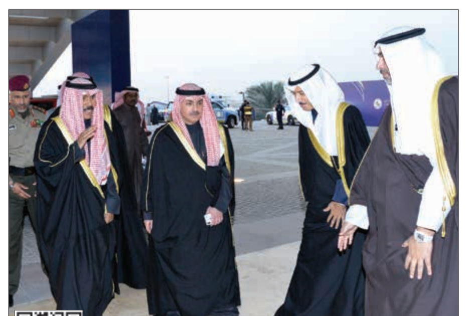
سمو ولي العهد الشيخ نواف الأحمد لحظة وصوله إلى الاستاد