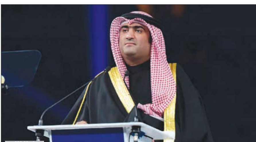
وزير التجارة والصناعة ووزير الدولة لشؤون الشباب خالد الروضان يلقي كلمته

أما الآن يا صاحب السمو راعي حقلنا الكبير فإنا أمام اللحظة الأهم يا من بعزمه بدأنا من جديد حيث بدأت الفرحة مجددا وما أعظم وأحلى شعور البدء، لذا استاذن سموك بأن تعلن البدء لهذه البطولة والانطلاق لفعاليتها فلك الحب والشكر... والكلمة.