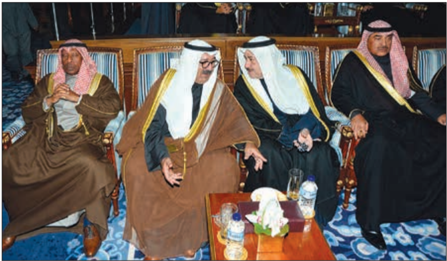
النائب الأول لرئيس الوزراء وزير الدفاع الشيخ ناصر صباح الأحمد والشيخ صباح الخالد والشيخ أحمد الحمود والشيخ علي العبدالله