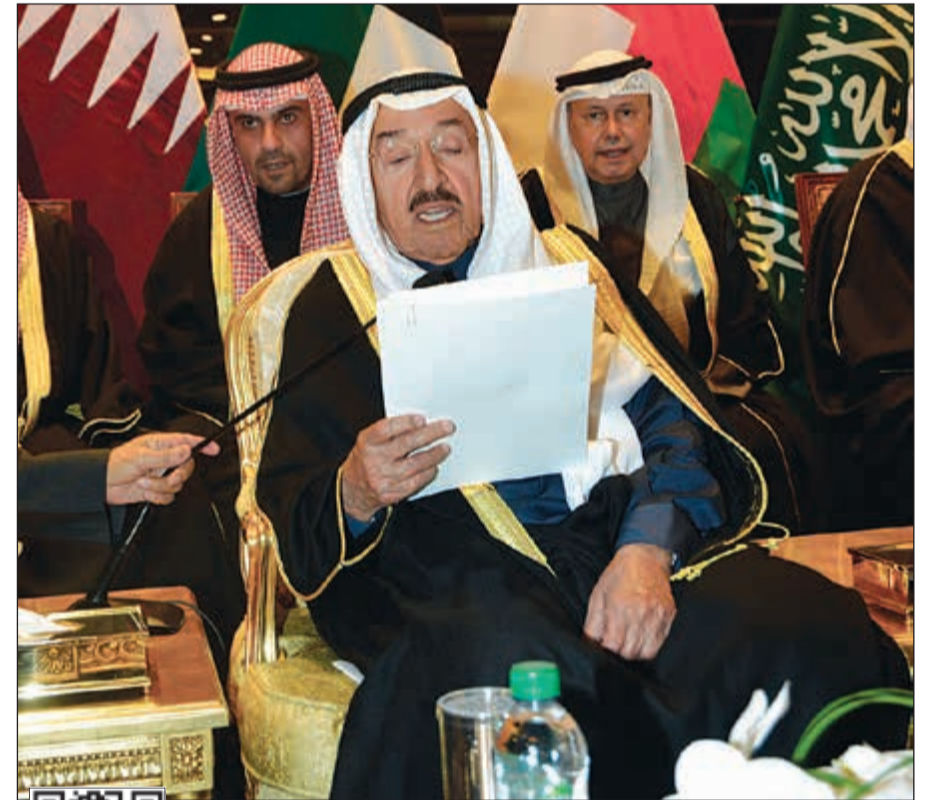
صاحب السمو الأمير الشيخ صباح الأحمد يعلن افتتاح البطولة

وصل موكب صاحب السمو الأمير الشيخ صباح الأحمد إلى استاد جابر الدولي الساعة 5:11 مساءً، وحيا سموه الجمهور الذي ملأ استاد جابر الدولي، حيث جال سموه في موكبه على مضمار الاستاد وسط تصفيق وصيحات وأغان تهللا وترحب بوصول سموه إلى الاستاد.