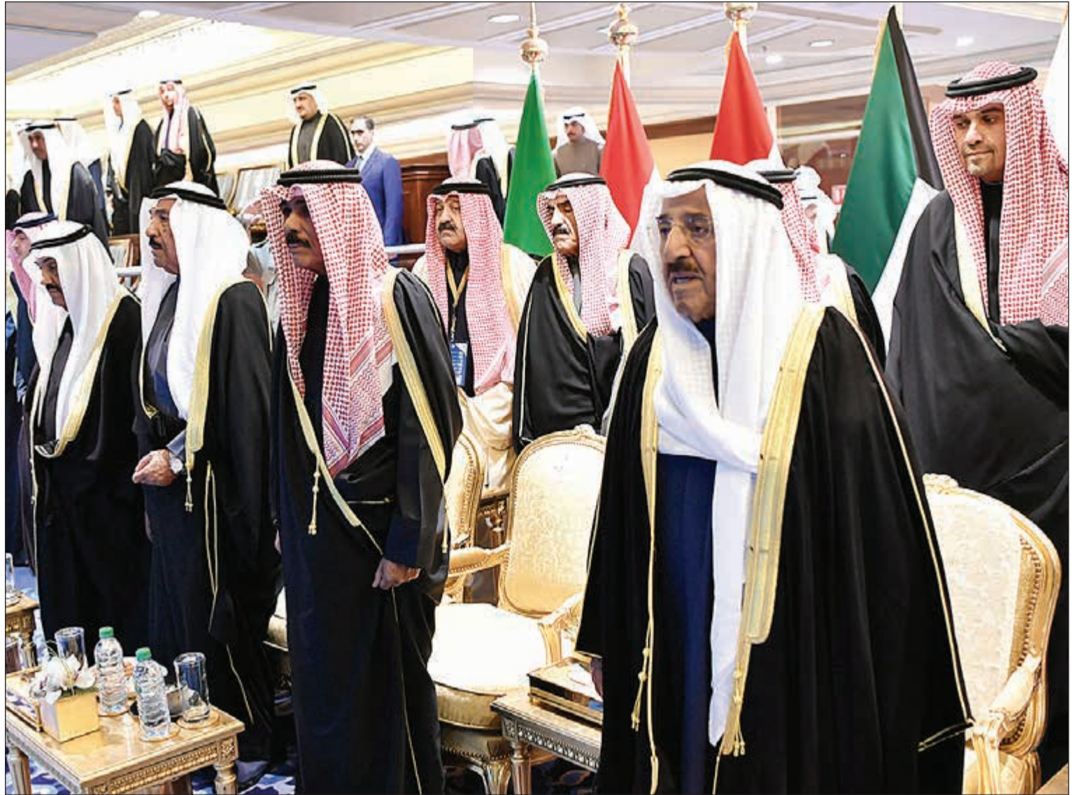
صاحب السمو الأمير الشيخ صباح الأحمد وسمو ولي العهد الشيخ نواف الأحمد والشيخ جابر العبدالله وسمو الشيخ ناصر المحمد وأنس الصالح والشيخ مبارك الفيصل والشيخ أحمد اليوسف خلال عزف النشيد الوطني