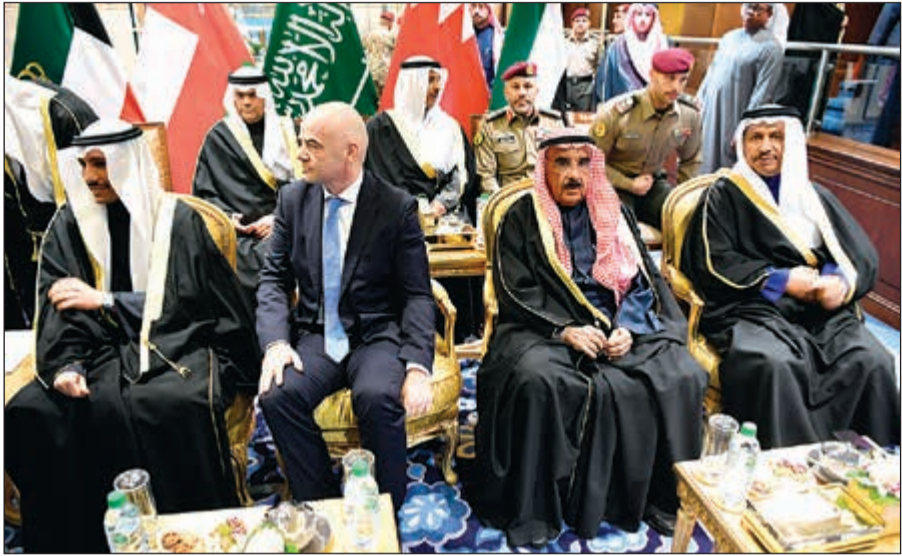
رئيس مجلس الأمة مرزوق الغانم والشيخ فيصل السعود وسمو الشيخ جابر المبارك وجياني إنفانتينو