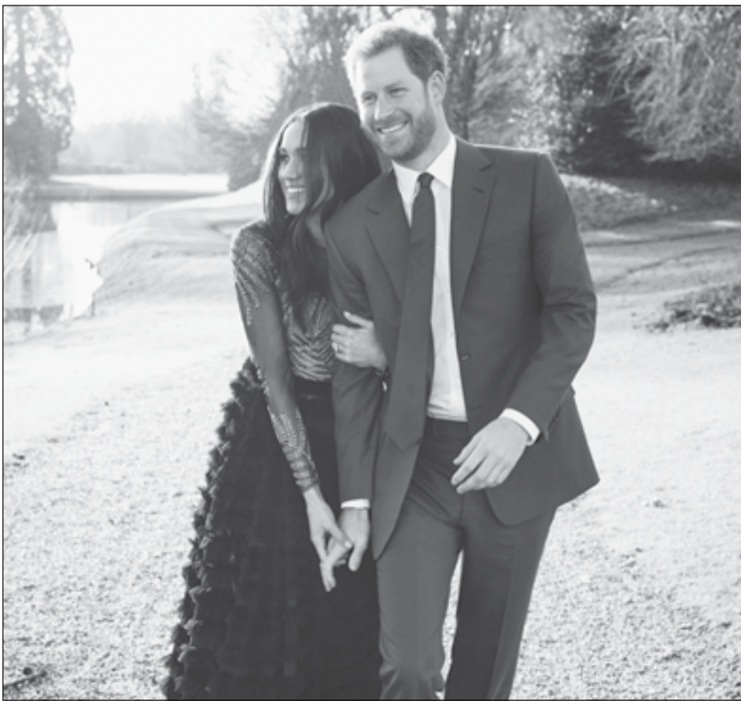
الأمير هاري وميجان

نشر الأمير البريطاني هاري وخطيبته الممثلة الأميركية ميجان ماركل أمس مجموعة صور لخطبتهما التقطها المصور أليكسي لوبوميرسكي المقيم في نيويورك. والتقط لوبوميرسكي، الذي كان مساعداً لماريو تيسينو واشتهر بتصوير الأميرة الراحلة ديانا والدة هاري، الصور هذا الأسبوع في مقر فروجيمور الملكي قرب قلعة وندسور غربي لندن، حيث من المقرر أن يتزوجا في 19 مايو أيار. وقال مساعداً لماريو تيسينو يسعني سوى الإبتسامة عندما أطلع الصور التي التقطتها لهما، تلك كانت سعادتهما معا، وأعلن الأمير هاري (33 عاماً) حفيد الملكة إليزابيث والذي يحتل المركز الخامس في ترتيب ولاية العرش وميجان (36 عاماً) خطبتهما الشهر الماضي.