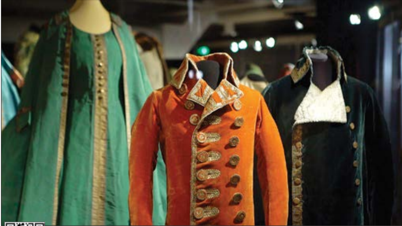
جانب من أزياء القياصرة في متحف ايرميتاج الشهير