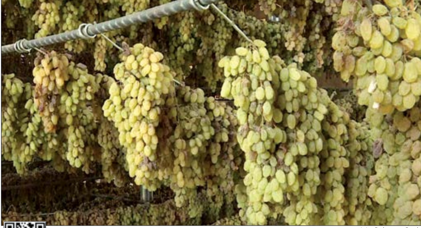
مزارع العنب تنتظر التجفيف