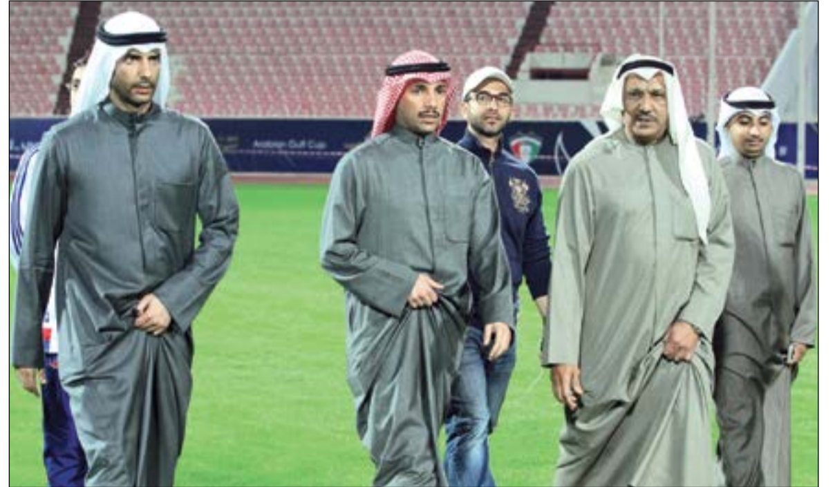
رئيس مجلس الامة مرزوق الغانم يتفقد الملعب ومعه خالد الغانم ووليد الراشد

بالإضافة إلى المنصة الأميرية. وأبلغ الغانم مستقبله حرص القيادة السياسية على نجاح البطولة وجاهزية جميع مرافق البطولة، لاسيما الملاعب الخاصة باستضافة المباريات والتدريبات، مؤكدا أن الحكومة تسعى لتكريس جميع طاقاتها لإنجاح البطولة التي تعتبر بمنزلة العرس الرياضي لجميع أبناء الخليج.