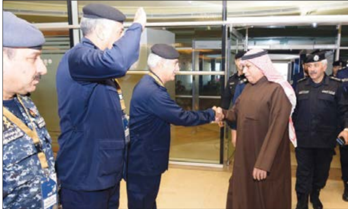
نائب رئيس مجلس الوزراء ووزير الداخلية الفريق الشيخ م. خالد الجراح لحظة وصوله الستاد

والفرعية والطرق البديلة ومواقف انتظار المركبات، وتم شرح عملية نقل الجمهور من مواقع الانتظار الخارجية إلى الستاد وكيفية تأمين مواقف الانتظار. وفي نهاية الجولة الميدانية وجه الجراح عددا من التوجيهات والملاحظات لاستيفاء كافة جوانب الخطة الأمنية والمرورية وتنفيذها على اكمل وجه، معربا عن تقديره العميق للجهود الحثيثة لرجال الأمن وارتباطه للاستعدادات التي تم اتخاذها من قبل الأجهزة الأمنية وكذلك الجهات المعاونة والمساندة، مشددا على أهمية التنسيق بين كافة الجهات المشاركة في الدولة في تلك الاحتفالية الرياضية الكبرى التي تعني الكثير بالنسبة للكويتيين والأشقاء الخليجيين حتى تتخلق بما يتفق ومكانة الكويت الحضارية والرياضية إقليميا ودوليا خاصة وأنها برعاية سامية من القيادة السياسية العليا الحكيمة.