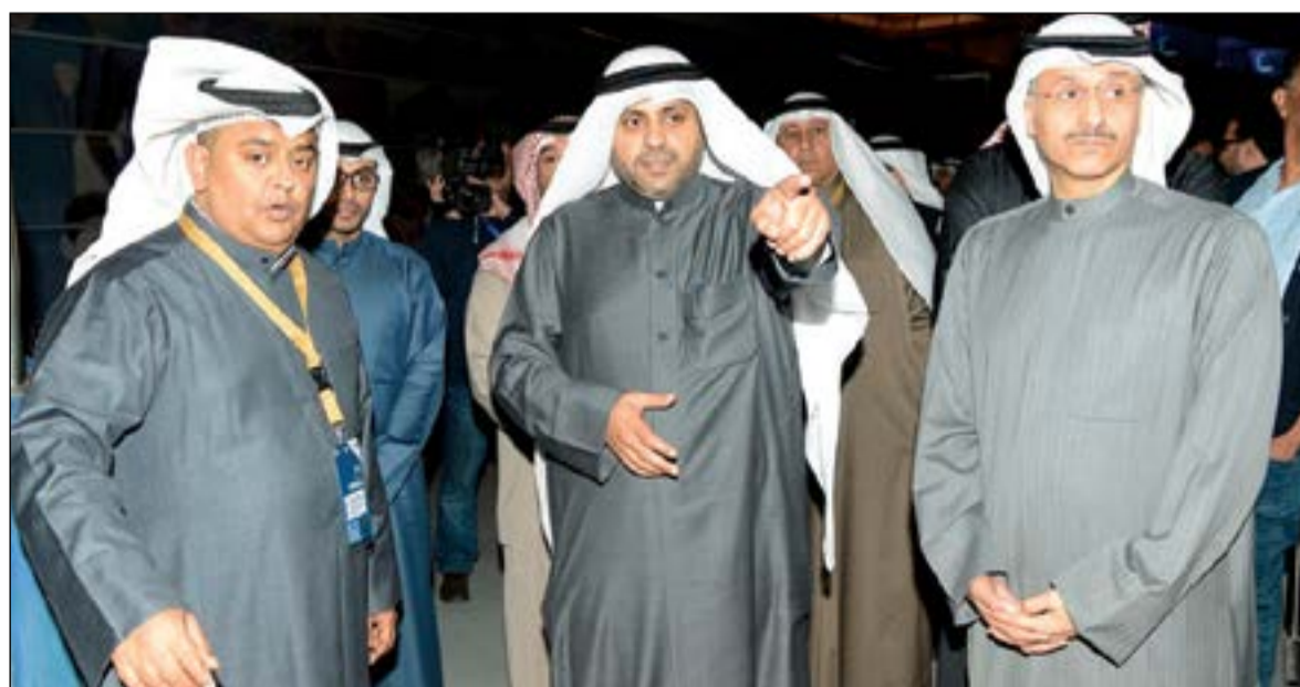
وزير الإعلام محمد الجبري يتابع آخر التطورات في الستاد

20 سيارة نقل تلفزيوني لبث أحداث البطولة وفق أعلى المواصفات كما جهزت 6 استديوهات خارجية للبث الإذاعي إضافة إلى توفير 250 كاميرا تلفزيونية عالية الوضوح والجودة من أجل التميز في نقل الصورة للمشاهدين. وأعرب الوزير الجبري عن شكره وتقديره لجميع العاملين من الوزارة على جهودهم في تجهيز كل الوسائل لتقديم تغطية رائعة للبطولة.