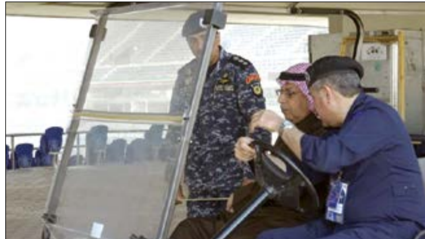
الجراح في جولة تفقدية على محيط الملعب

وكان في استقبال الجراح لدى وصوله رئيس اللجنة الأمنية اللواء جمال الصايغ، ورؤساء اللجان والقيادات الأمنية الميدانية المختصة. واستعرض الجراح على أرض الواقع خطة وزارة الداخلية والجهات المعاونة