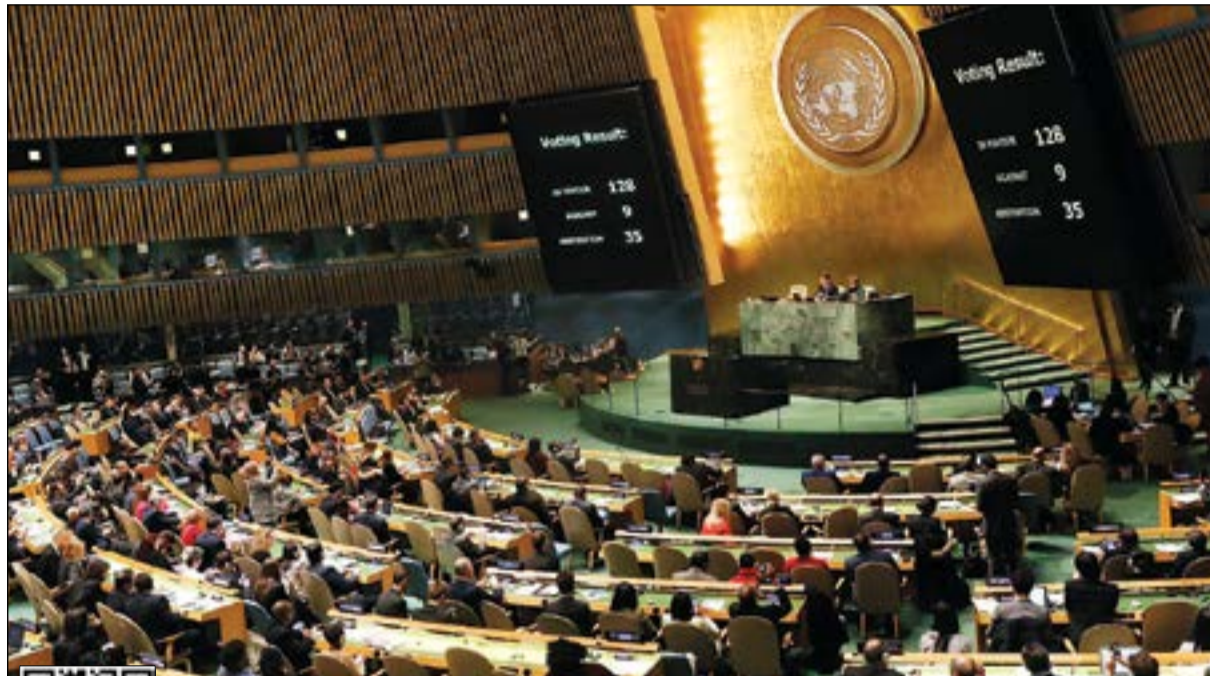
جانب من التصويت في الجمعية العامة للأمم المتحدة أمس