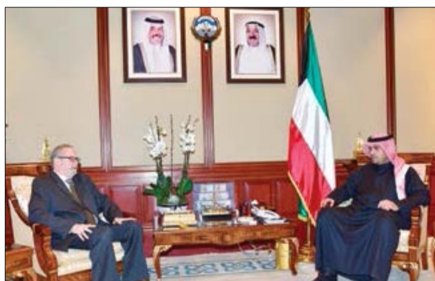
أنس الصالح مستقبلا السفير لورانس سيلفرمان

أشاد نائب رئيس مجلس الوزراء وزير الدولة لشؤون مجلس الوزراء أنس الصالح بالمستوى «المتين» للعلاقات الثنائية التي تربط الكويت بالولايات المتحدة الأميركية. وقال بيان صحفي صادر عن مكتب وزير الدولة لشؤون مجلس الوزراء إن ذلك جاء خلال لقاء الوزير الصالح أمس مع سفير الولايات المتحدة الأميركية لدى الكويت لورانس سيلفرمان. وأضاف البيان ان الوزير الصالح أعرب للسفير سيلفرمان عن تطلع الكويت لتطوير علاقاتها مع أميركا في كل المجالات بما يخدم المصالح المشتركة بين البلدين الصديقين.