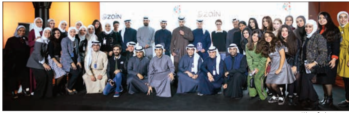
صورة جماعية من المؤتمر