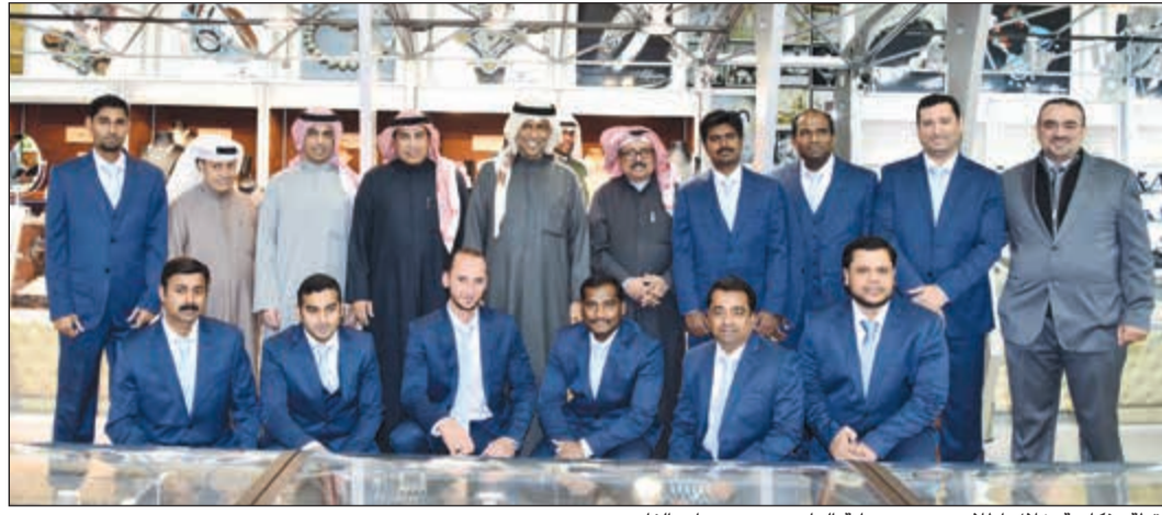
لقطة تذكارية خلال اطلاق عروض نهاية العام من مجوهرات الفارس