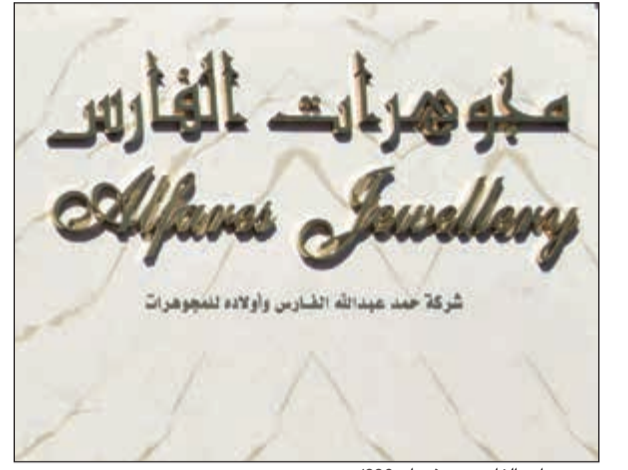
مجوهرات الفارس منذ عام 1880

أينما تم شراء الألباس. وهذه الشهادة مهمة جدا خصوصا بالأونة الأخيرة، إذ أصبح ملزما تزويد بشهادات من أماكن موثوق منها وشهادات أصلية بما أن الشهادات المقلدة أصبحت شائعة وهو ما يدفع الزبائن إلى الشراء من تاجر مجوهرات موثوق به. وتقدم «مجوهرات الفارس» قطع الكريمة التي يتراوح أوزانها من 10 - 20 و 30 و 40 قيراطا. كما تمتلك «مجوهرات الفارس» قطعاً ثمينة ونادرة وشديدة النقاوة مثل قطعة الدرجة الأولى من شدة نقاوته بوزن 40 قيراطا، وقطعة أخرى بوزن 20 قيراطا، وغيرها الكثير من القطع التي تتفاوت أسعارها بحسب النوعية والتصميم إلى جانب قطع أخرى تكون أسعارها في متناول الجميع.