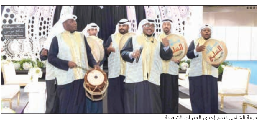
فرقة الشامي تقدم إحدى الفقرات الشعبية

أعلنت «سنتر بوينت» سلسلة متاجر الأزياء الأضخم على مستوى الشرق الأوسط، عن إطلاق أحدث تشكيلاتها الحصرية من الأزياء بمناسبة موسم الأعياد لعام 2017، وتدعو عملاءها لاستقبال موسم الأعياد والتألق بإطلالة شتوية عصرية تخطف الأنظار في مختلف المناسبات. حيث تضم التشكيلة الجديدة قطعاً فريدة من علامات «سنتر بوينت» الأكثر شعبية، مثل «سبلاش» و«بجي شوب» و«لايف ستايل» و«شومارت»، والمتوافرة جميعا في مختلف متاجر السلسلة في الكويت. وتحمل تشكيلة «سنتر بوينت» لشتاء 2017 بصمات قوية لحقبة التسعينيات، والتي تجسد في الطابع الجمالي الفريد للتصاميم المستوحاة من موسيقى «الجرنج» وتلك التي تحاكي المناظر الكونية المدهشة، وتتميز التشكيلة باحتضانها للعديد من القطع المختلفة، والتي تتيح للسيدات التائق بمجموعة متنوعة من الإطلالات العصرية خلال الأشهر الباردة.