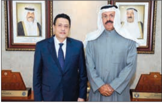
الفريق أول م. الشيخ أحمد النواف مستقبلاً السفير طارق القوني

وتمنى المحافظ للسفير القوني التوفيق في دفع العلاقات بين البلدين إلى آفاق أرحب، في حين أعرب