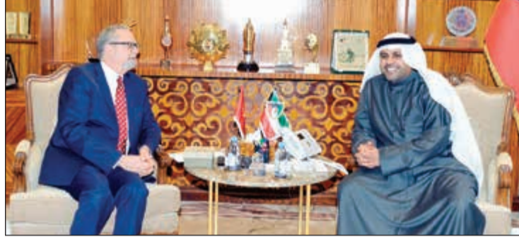
الوزير محمد الجبري خلال اللقاء مع السفير الأميركي لورانس سيلفرمان

وأشاد سيلفرمان بالإنجازات والقفزات التي حققها الإعلام الكويتي، مؤكداً أهمية التعاون بين البلدين الصديقين في مجال الإعلام والثقافة والفنون.