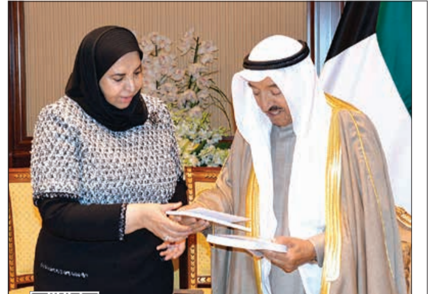
صاحب السمو الأمير الشيخ صباح الأحمد يتسلم كتابين من الشيخة د. سعاد الصباح