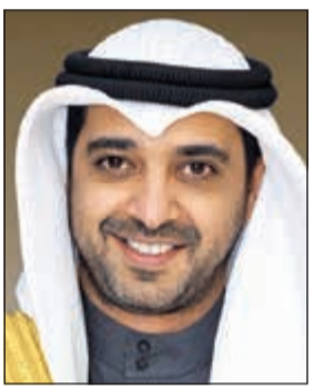
الشيخ محمد العبدالله

تأكيدا لما انفردت «الأنباء» بنشره في 17 الجاري صدور مراسيم تعيين الجراح وزيراً للديوان الأميري والعدالة نائبا والخالد مستشارا