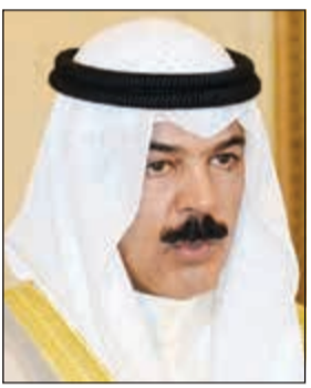
الشيخ محمد الخالد

مرسوم آخر بتعيين وزير الدولة لشؤون مجلس الوزراء ووزير الإعلام بالوكالة السابق الشيخ محمد العبدالله نائبا لوزير شؤون الديوان الأميري بدرجة وزير. هذا، وصدر مرسوم ثالث بتعيين نائب رئيس مجلس الوزراء ووزير الدفاع السابق الشيخ محمد الخالد مستشارا في الديوان الأميري.