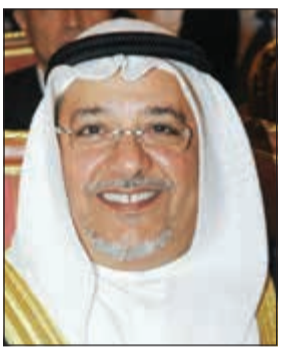
الشيخ علي الجراح