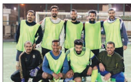
صورة جماعية لفريق الفردان