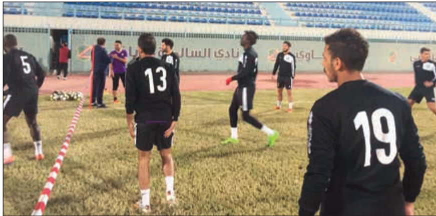
العربي عاود تدريباته

منح لاعبي الأخضر الشباب الفرصة للمشاركة واثبات الوجود تمهيدا لتصعيد عدد منهم إلى الفريق الأول في المرحلة المقبلة.