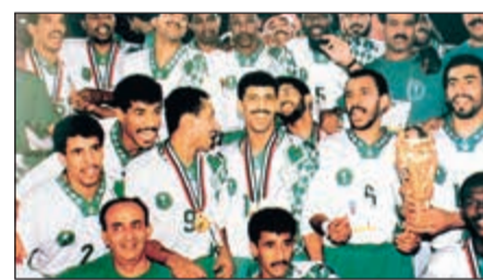
تتويج السعودية بخليجي 12

واستطاع المنتخب السعودي ان يكتب التاريخ في بداية الالفية عندما خاض المباراة تلو الأخرى بدون خسارة حتى تغلب على شقيقه القطري بنتيجة 3-1 في آخر مواجهاته ليتوج بطلا لكاس