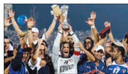
فرحة تمنتى تكرارها يا الأزرق

واليوم، يحتضن وطن النهار وبلد «الصداقة والسلام» بطولة كأس الخليج الثالثة والعشرين، فهل سيستطيع المنتخب القطري المحافظة على الكاس، او ستكون المنافسة شديدة بين منتخبات الإمارات والسعودية وعمان، أم سيرجع اللقب الى معشوقه القديم، او أننا سنشهد ميلاد بطل جديد؟