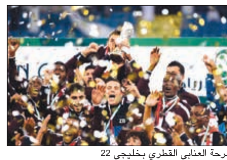
فرحة العنابي القطري بخليجي 22