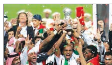
الأبيض الإماراتي بطل خليجي 21

واستطاع المنتخب السعودي ان يكتب التاريخ في بداية الالفية عندما خاض المباراة تلو الأخرى بدون خسارة حتى تغلب على شقيقه القطري بنتيجة 3-1 في آخر مواجهاته ليتوج بطلا لكاس