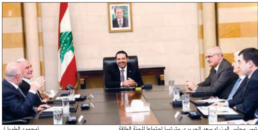
رئيس مجلس الوزراء سعد الحريري مترشحا اجتماعا للجنة الخاصة (محمود الطويل)

في جبل محسن «لأن مكاتب الحزب العربي الديموقراطي هي مكاتب التيار، ويجب عدم فتح الجبل على بازار المكاتب الانتخابية». لكن المجلس الاسلامي العلوي والحزب العربي الديموقراطي رفضا استقبال باسيل، وقامت عناصر تابعة لهما بإنزال بافطات التحذير في هذا الحي، وكذلك الصور، ونكرت قناة «الجديد» ان 564 من أبناء هذا الحي انتسبوا إلى التيار البرتقالي عمداً إلى ترميز بطاقتهم بحجة ان قيادة التيار وعدت بتوظيفهم لكنها لم تف بالوعد كما قال عضو المكتب السياسي للحرز العربي الديموقراطي (العلوي) علي فضة، في ضوء هذه المستجدات السياسية، طرح السؤال: ماذا عن التحالفات الانتخابية؟ وبالتالي ماذا عن الانتخابات بذايتها هناك من بدأ يتحدث عن ان التحالفات الخماسية بين التيار الحر والمستقبل وحزب الله وحركة أمل والتقدمي الاشتراكي هو تحالف سياسي وليس انتخابي، ومعنى هذا الكلام ان لا شيء ثابتاً في بلد الرمال المتحركة، لا التحالفات بحد ذاتها، وعلى الرغم من اصرار الرئيس نبيه بري على إجراء الانتخابات في موعدا، وأن الانتشغال بالانتخابات لا ينبغي ان يكون ذلك يفعل ارادي محلي، سيما مع تصاعد الازمات الإقليمية من القدس إلى غزة إلى الأستانك الأميركي - الإيراني والخليجي - الإيراني، فضلاً عن استمرار البرودة في علاقات لبنان مع الخليج والتي تبدو مرشحة للتجدد بعد مطلع السنة الجديدة إذا ما استمرت حالة اللاوعي السياسي متحركة بالموافق اللبنانية، والتي يمكن ان تقود إلى خفض التمثيل الدبلوماسي الخليجي إذا ما استمر الالتزام بـ «النأي بالفسح» على هذا المستوى المتدني من التنفيذ، وفقاً لما نقلته مصادر «الأنباء».