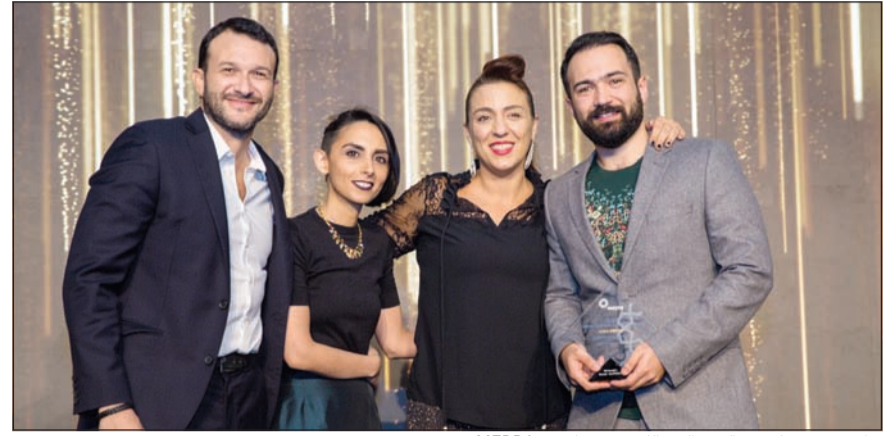
جانب من تسليم «ماك دونالدز الكويت» جائزة «MEPRA»

فازت حملة «قصة اللحم» الحملة التسويقية الشاملة التي أطلقتها ماك دونالدز الكويت، بجائزتين ذهبيتين ضمن جوائز جمعية العلاقات العامة في الشرق الأوسط لعام 2017 (MEPRA)، وذلك خلال حفل توزيع الجوائز السنوية المرموقة والرائدة في مجال الإعلام والتواصل الذي أقيم مؤخرا في دبي. ولقد حصلت الحملة المبتكرة والفريدة من نوعها، التي تم ابتكارها وتنفيذها بالتعاون مع شركة وبيير شانديوك الكويت، على الجائزة الكبرى عن فئة «إدارة الأزمات»، بالإضافة إلى جائزة «الأفضل في الكويت». وقد ابتكرت هذه الحملة للرد على سيل من القصص الكاذبة والإشاعات المفلقة التي انتشرت عبر وسائل التواصل الاجتماعي حول نوعية وجودة لحم البقر الذي تستخدمه ماك دونالدز، ومن هنا انطلقت حملة «قصة اللحم» كتجربة اجتماعية سعت إلى الكشف عن زيف هذه القصص وتزويد الناس بنظرة عن الحقائق بشكل مبتكر، وركزت الحملة على اختبار تذوق لحم البقر لدى «ماك دونالدز»، أقيم بدون الكشف عن هوية المطعم، وذلك بهدف قياس آراء الناس بشكل صريح وشفاف وبدون أي أفكار مسبقة، وأصبحت تجربة «لحم البقر»، التي تم تصويرها بالكامل وعرضها في مقطع فيديو عبر القنوات الإلكترونية، تجربة افتراضية ناجحة بكل معنى الكلمة بفضل رسالتها القوية رغم بساطتها، والتي سلطت