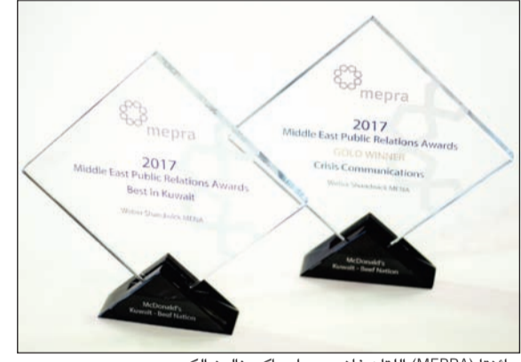
جائزتا (MEPRA) اللتان فازت بهما «ماك دونالدز الكويت»