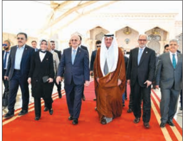
نائب الرئيس عيسى الكندري مودعا كهرمان

غادر البلاد بعد ظهر امس رئيس البرلمان التركي الكبير اسماعيل كهرمان والوفد المرافق له بعد زيارة رسمية استغرقت يومين. يذكر أن زيارة كهرمان جاءت تلبية لدعوة من رئيس مجلس الأمة مرزوق الغانم. وكان في وداع الضيف والوفد المرافق له