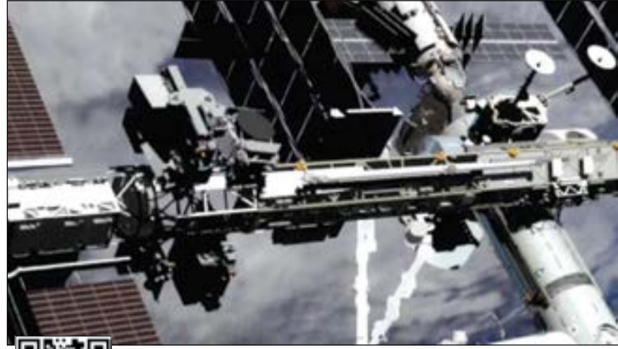
محطة الفضاء الدولية تراقبنا عن كثب