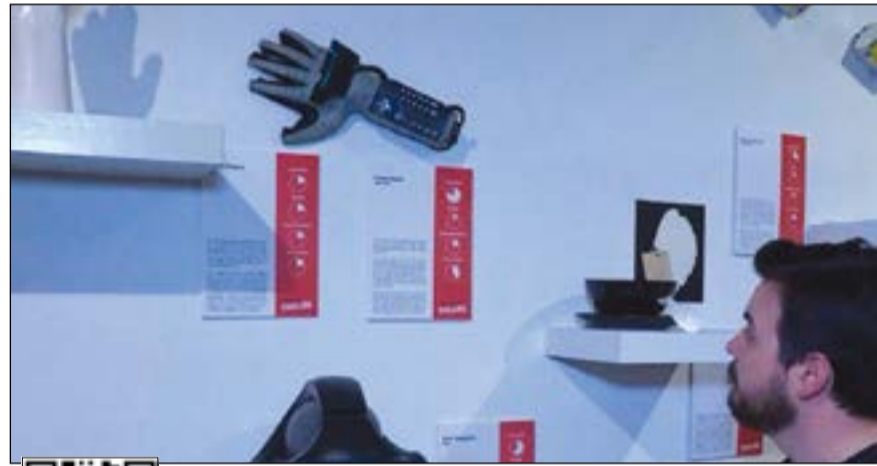
ابتكارات لم تحظ بالنجاح