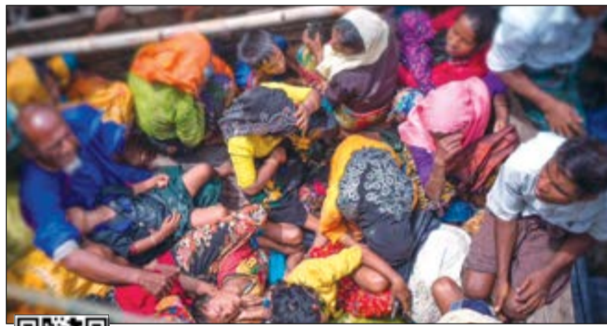
مأساة الروهينغا مستمرة

قبل النزوح الجماعي في سبتمبر 2017، كان عدد أقلية الروهينغا المسلمة في بورما نحو مليون نسمة في بلد يشكل البوذيين أكثر من 90٪ من سكانه.