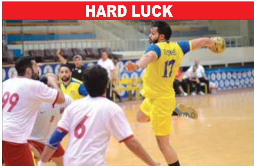
استمرار تراجع نتائج عدة فرق وهي الفحيحيل، التضامن، الجهراء، النصر، الساحل والشباب مع اعتماد بعض الأجهزة الفنية على دعم المدرجات أحيانا.