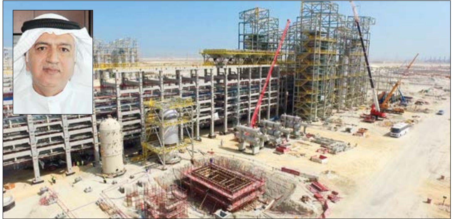
صورة تظهر آخر تطورات الاعمال في مشروع مصفاة الزور قبل أيام قليلة وفي الإطار م.هاشم هاشم

أكدت الشركة الكويتية للصناعات البترولية المتكاملة (كبيك) في بيان صحفي أمس أن معدلات الإنجاز في مشروع مصفاة الزور بلغت 45% دون وجود أي تأخير في إنجاز المشروع بحزمه المختلفة. وقالت إنه سيتم الانتهاء من المشروع في نهاية عام 2019 وفقا للخطة الموضوعية. وأضافت أنه بالنظر إلى أهمية مثل هذه المشاريع فإن مجلس إدارة مؤسسة البترول الكويتية قام أخيرا برفقة أعضاء مجلس إدارة (كبيك) بجولة ميدانية للاطلاع على سير العمل في عدة مشاريع شملت الحزم الخمس في مصفاة الزور ومرافق استيراد الغاز الطبيعي. وأعرب الرئيس التنفيذي في مؤسسة البترول الكويتية نزار العدساني حسب البيان عن الأمل في أن يتم تشغيل الوحدات الأولية في مشروع مصفاة الزور خلال شهر مايو 2019 باعتباره مشروعا ضمن استراتيجية المؤسسة لعام 2030. وقال العدساني إن مشروع مصفاة