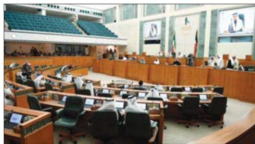
جانب من إحدى الجلسات