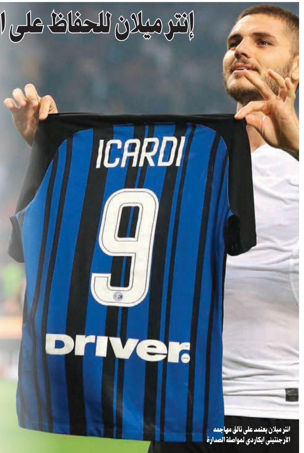
انتر ميلان يعتمد على تاتي مهاجمه افرنجيني إيكاردى لمواصلة الصدارة