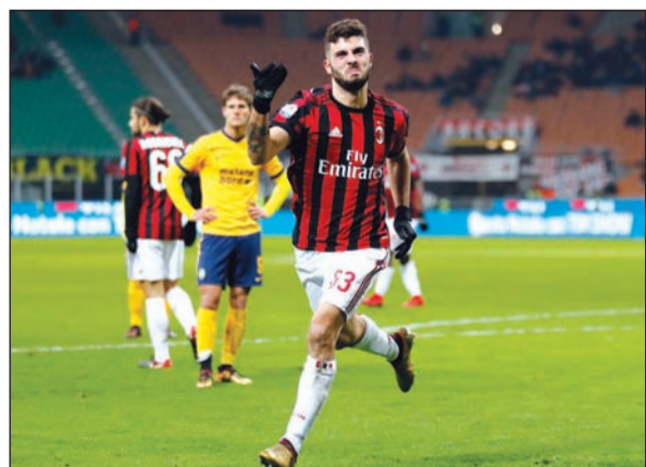
الواعد كوتروني يؤكد فوز اللومباردي

الرابطة الفرنسية. سجل يوان سامبييه (12 خطأ في مرمي فريقه) والأرجنتيني دي ماريا (25) والبرازيلي الفيس (62) والألماني دراكسلر (78) وجرمان، وجيريمي غريم (36) وبلاياك (88) لستراسبورغ. وكان ستراسبورغ الحق بباريس الخسارة الأولى هذا الموسم في الدوري (1-2). وخاض سان جرمان مباراته بغياب نجمه البرازيلي نيمار.