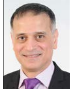
إعداد: د. طارق البكري