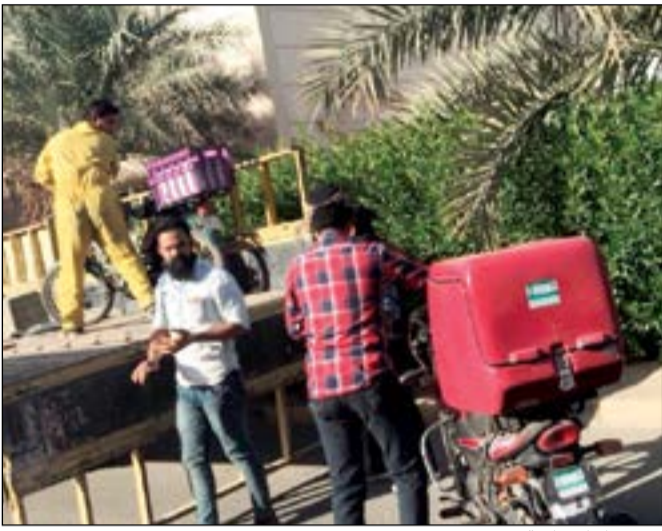
رفع دراجات نارية

قامت النوبة «أ» بمراقبة إشغالات الطرق في بلدية الجهراء بحملة على الباعة المتجولين. وقد أسفرت عن رفع 6 دراجات نارية وإرسالهم إلى موقع الحجز بجانب تحرير مخالفة بائع متجول.