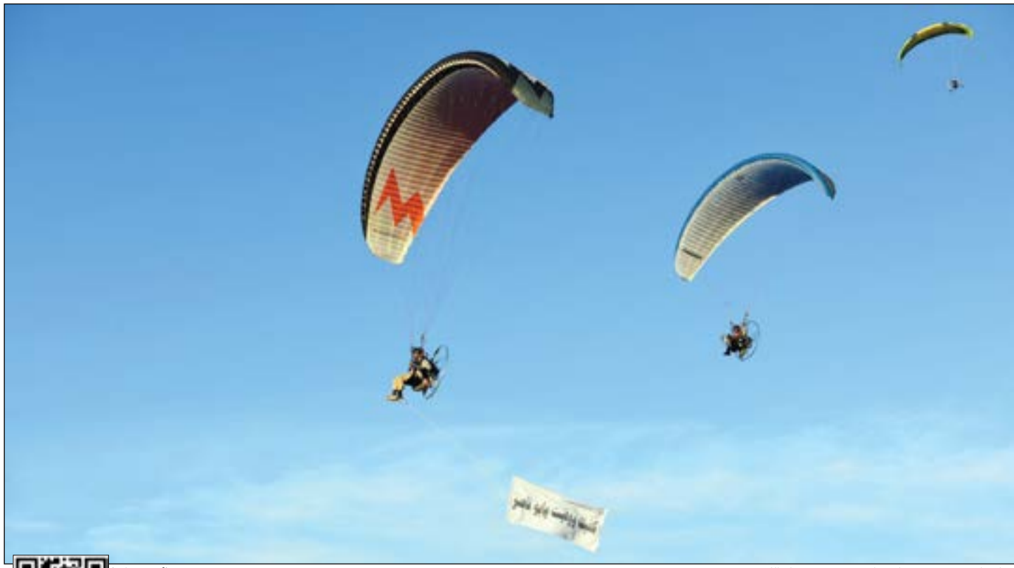
شعار «كفيت ووفيت يا بوناصر» يزين سماء الكويت