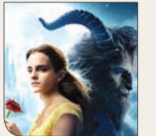
Beauty and the Beast

القائمة القصيرة للأفلام الروائية المرشحة لجائزة الأوسكار في فئة المؤثرات البصرية: