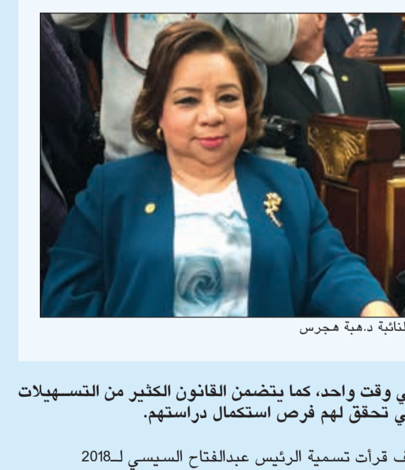
حوار: هالة عمران

كشفت عضو مجلس النواب - النائبة عن ذوي الإعاقة د.هبة هجرس عن صدور قانون ذوي الإعاقة الجديد مع نهاية ديسمبر الجاري، مؤكدة انه قانون شامل وحقيقي ويشمل كافة الفئات. وأوضحت هجرس في لقاء خاص مع «الأبناء» أن 90٪ من حالات ذوي الإعاقات يمكن دمجها في التعليم العادي، كما أشارت الى وجود 13 مليون شخص معاق أي ما يعادل 12٪ من سكان مصر. وأكدت هجرس على الحيادية التامة في التعامل مع مصابي الحوادث الإزاحية والذين يتعرضون الى إعاقات. متمنة التحسن المميز في تصنيف مصر داخل القياس العالمية في رعاية ذوي الإعاقة، ومشيدة بروية وأجواء الرئيس عبدالفتاح السيسي للشعب المصري بجمع شرائح من خلال عدسة مكبرة لبلورة جميع المشكلات، وقالت انه وعقب النجاح مع وزارة الأوقاف والأزهر الشريف في إتاحة الفرصة لذوي الإعاقة لسماع خطبة الجمعة بلغة الإشارة، فإننا نناقش الآن مع الأزهر والأوقاف تسهيلات دمج ذوي الإعاقة في الجامعات والمعاهد الجديدة.. وإلى تفاصيل اللقاء: