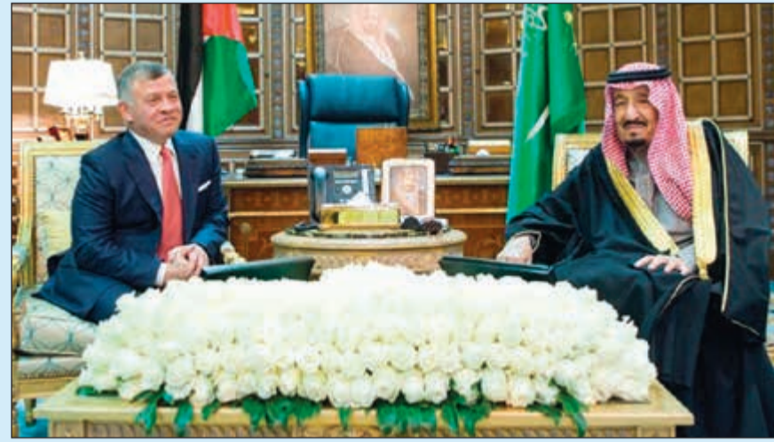
خادم الحرمين الشريفين الملك سلمان بن عبدالعزيز مستقبلاً الملك عبدالله الثاني

بالإضافة إلى تنسيق الجهود لمكافحة الإرهاب. كما التقى صاحب السمو الملكي الأمير استعراض العلاقات السعودية الأردنية في مختلف المجالات والسبل الكفيلة لتطويرها، الفلسطينية وفقاً للقرارات الدولية ذات الصلة والمباراة العربية للسلام. كما جرى