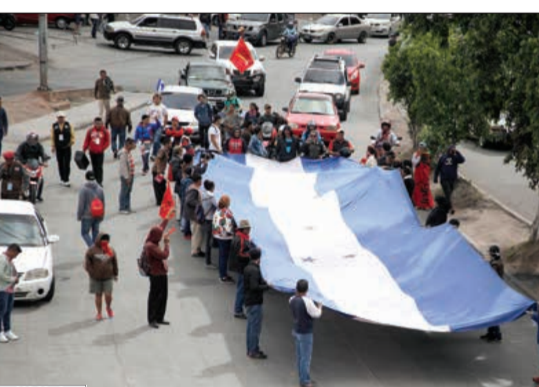
جانب من احتجاج المعارضة في هندوراس امس الاول

لمشاهدة الفيديو يمكن استخدام QR كود أو الـ