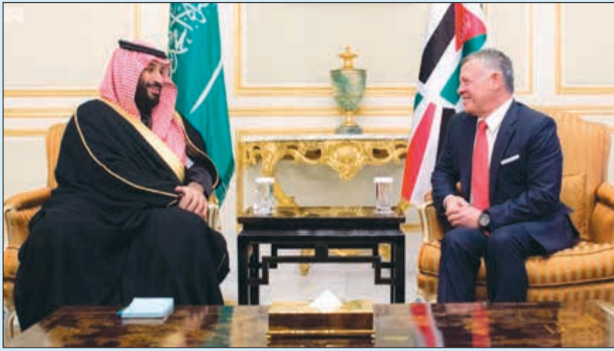
.. وصاحب السمو الملكي الأمير محمد بن سلمان مستقبلاً الملك عبدالله الثاني بن الحسين

محمد بن سلمان بن عبدالعزيز ولي العهد نائب رئيس مجلس الوزراء وزير الدفاع امس جلالة الملك عبدالله الثاني بن الحسين ملك المملكة الأردنية الهاشمية، حيث جرى خلال اللقاء استعراض مستجدات الأوضاع في منطقة الشرق الأوسط، بما فيها القرار الأميركي بالاعتراف بالقدس عاصمة لإسرائيل ونقل سفارتها إليها، والتدابير السبلية الكبيرة لهذا القرار الذي يعد تراجعاً كبيراً في جهود الدفع بعملية السلام، كما تم التأكيد على الحقوق التاريخية الثابتة للشعب الفلسطيني في القدس وغيرها من الأراضي المحتلة، والتي كفلتها القرارات الدولية ذات الصلة.