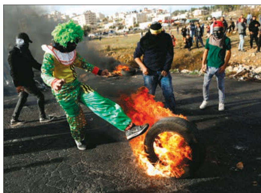
جانب من الاشتباكات بالقرب من مستوطنة بيت ايل قرب رام الله بالضفة الغربية امس

الفلستينيين الإجمالي، منذ إعلان ترامب، قد ارتفع إلى مائتي معتقل. الي، ذلك، اقتحم 49 مستوطناً إسرائيلياً، امس باحات المسجد الأقصى في مدينة القدس، لحماية الشرطة الإسرائيلية التي سمحت لعناصر من القوات الخاصة بها، باقتحام المسجد الأقصى بعد فتح «باب المغاربة»، وذلك لتأمين اقتحامات اليهود وتجوّلوا في باحاته، وذلك من «باب المغاربة»، وحتى «باب السلسلة»، الذي شهد صولات بعض اليهود «التلمودية» عقب خروجهم من المسجد الأقصى. من جانبه، دعا رئيس الوزراء الفلسطيني رامي الحمد الله، الأمم المتحدة ومجلس الأمن الدولي إلى تحمل مسؤولياتهما التاريخية، وإجبار إسرائيل على إنهاء احتلالها لأراضي دولة فلسطين بما فيها القدس الشرقية. وقال «الحمد الله» في مؤتمر صحافي امس، قبيل الاجتماع الأسبوعي للحكومة الفلسطينية في رام الله، إن «فلسطين بشعبها وحكومتها وقيادتها ترفض قرار الرئيس الأميركي دونالد ترامب الاعتراف بالقدس عاصمة لإسرائيل، ونقل سفارة بلاده إليها». وأضاف «هذا قرار ظالم وانتهاك للشرعية الدولية وقرارات مجلس الأمن، واعداً على شعبنا»، فيما أكد على «التمسك بالقدس عاصمة لدولة فلسطين».