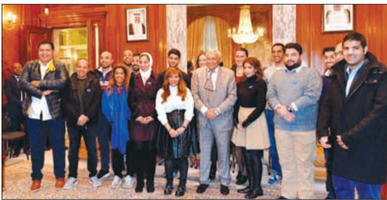
السفير خالد الدويسان مستقبلاً مبادري «زين» في مقر السفارة بلندن