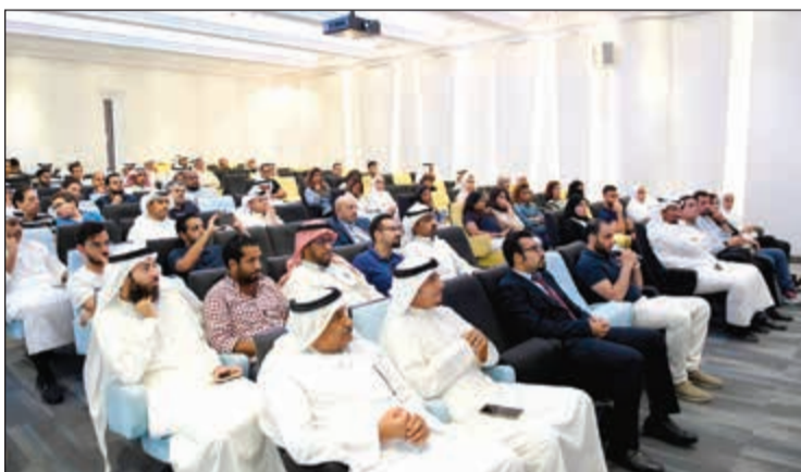
المشاركون في مرحلة المعسكر التدريبي