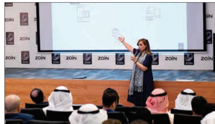
لقطة من الورشة التثريبية الأولى

في مدينة سان فرانسيسكو (وتحديداً وادي السيليكون - العاصمة الروحية لريادة الأعمال حول العالم) لمدة أسبوعين، وكان برفقتهم مؤسسة Mind The Bridge الاستشارية التي أخذتهم في جولة تدريبية مكثفة لتطوير وتسريع مشاريعهم التكنولوجية التي قدموها أمام لجنة التحكيم بصورتها الأولية في الكويت. واستعرض المبادرون مشاريعهم أمام الإدارة العليا في مؤسسة Mind The Bridge، والذين قاموا بدورهم بمشاركة خبراتهم الاستشارية في مجالات الإدارة والأعمال مع المبادرين. هذا، بالإضافة إلى تخصيص يوم كامل قام المبادرون من خلاله بالالتقاء بمجموعة من رواد الأعمال المحليين في سان فرانسيسكو، وقاموا بمشاركة خبراتهم الشخصية وقصص نجاحهم معهم.