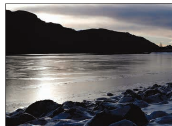
بحيرة متجمدة في اسكتلندا

أ.ف.ب: بقيت مئات المدارس مغلقة امس في بريطانيا بسبب تساقط الثلوج والجليد بعدما وضعت مصلحة الأرصاد الجوية غالبية مناطق ويلز ووسط إنجلترا في حالة إنذار فيما سجلت حركة الطيران اضطرابا لليوم الثاني على التوالي. وعادت الكهرباء إلى أكثر من 100 ألف منزل فيما حاولت المطارات إعادة جدولة الرحلات عقب أول تساقط كثيف للثلوج هذا الشتاء الذي اعتبر الأشد منذ أربع سنوات.