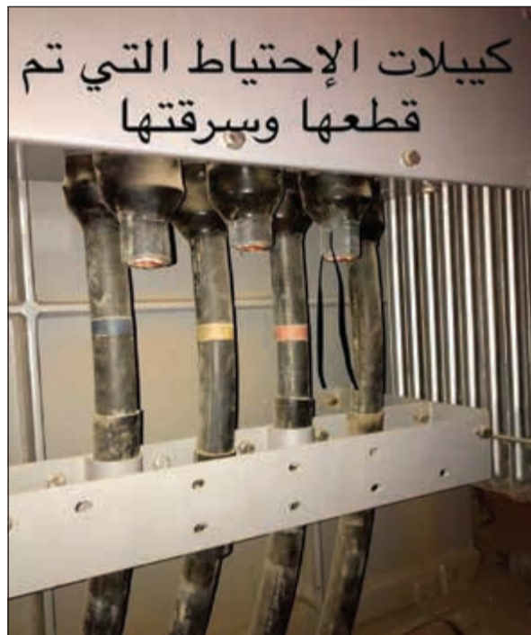
كيبلات احتياطية تمت سرقتها