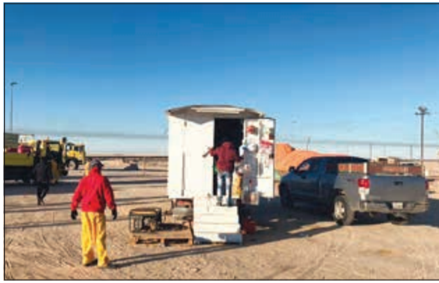
من الحملة على الباعة المتجولين

شنت دوريات الأمن العام التابعة لمخفر الوفرة بالاشتراك مع البلدية حملة على تجمع بائعي الأعلاف المخالفين في منطقة الوفرة، وكان قد تم انذارهم سابقا بالابتعاد عن الطريق بما لا يقل عن 500 متر داخل البر، لكنهم لم يمتثلوا، فقام فريق الإزالة مع الجرافات ومعداتنا بإزالتها وتمت مصادرة الأعلاف وتسجيل مخالفات، وبالإضافة إلى ضبط عدد من مخالفي الإقامة وإحالتهم إلى جهة الاختصاص.