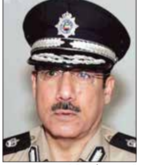
الفريق م. أنور الياسين

أبلغت مصادر قانونية «الأنباء» أن الدعوى التي تقدم بها الفريق متقاعد أنور الياسين بشأن طلب تفويض ورد اعتبار من وزارة الداخلية حددت لها جلسة في 27 الجاري. وبحسب المصادر القانونية فإن الفريق الياسين رفع قرابة