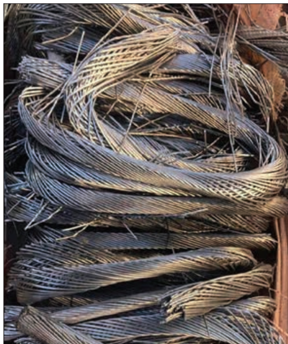
لغائف الأسلاك المسروقة