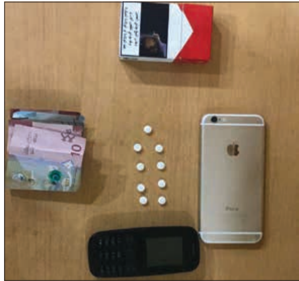
المضبوطات أحييت لـ المكافحة