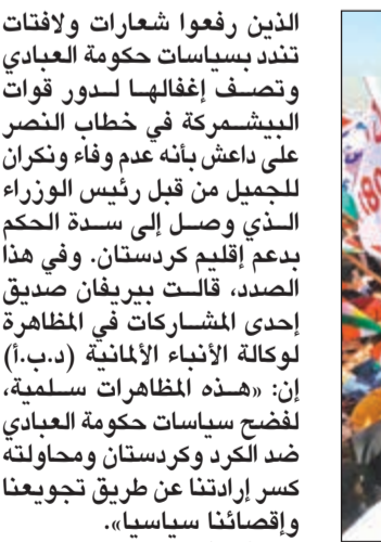
مظاهرات كرد اكراد يلوحون بعلمهم الوطني ويرفعون لافتات منددة برئيس الوزراء العراقي خلال مسيرة احتجاجية في أربيل أمس