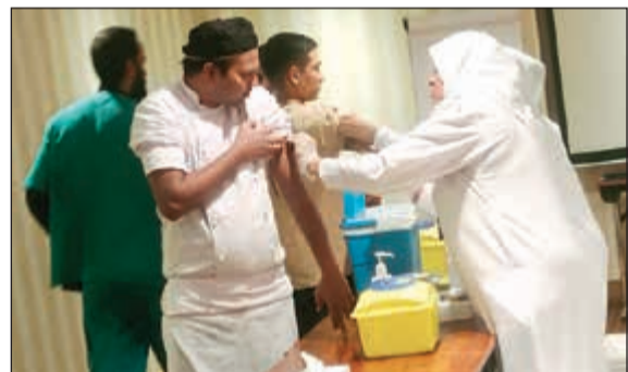
تطعيم أحد الموظفين