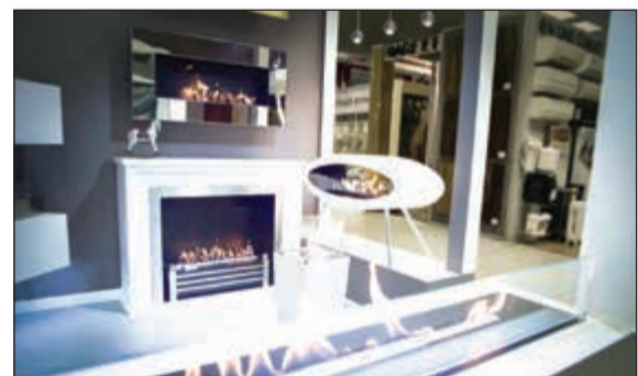
مدفأة decoflame من «الشعلة الخضراء»

والخليج، في مجال تصميم وتنفيذ شبكات الغاز طبقا للمواصفات العالمية للسكن الخاص والمشاريع التجارية، والمطاعم والفنادق وشركات الصناعة والتجهيزات الغذائية، وهي الوكالة الحظي لـ 14 شركة عالمية في مجال الغاز. وأكد الخضر «الشعلة الخضراء» بالعمود التي يتم التعاقد عليها من حيث دقة المواصفات ومواعيد التسليم، موضحا أن الشركة أنشئت منذ 12 عاما ووصلت إلى مصاف الشركات الأولى في الكويت لتمديد الغاز.