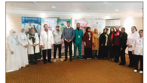
لقطة تذكارية خلال حملة التطعيم في كوبثورن الجهراء