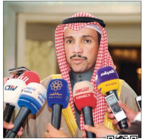
رئيس مجلس الأمة مرزوق الغانم

أكد رئيس مجلس الأمة مرزوق الغانم ضرورة منح الحكومة الجديدة الفرصة، وأن الحكم يجب أن يكون على أدائها وليس أسماء وزرائها. وقال الغانم في تصريح إلى الصحافيين أن التشكيلة تضم 9 وجوه جديدة ما يعني أنه فريق عمل شبه جديد. وأضاف: لا بد من قيام المجلس بمد يد التعاون لهذه الحكومة المطالبة هي كذلك بالتعاون مع المجلس. وفيما يتعلق بالجلسة الخاصة حول قرار