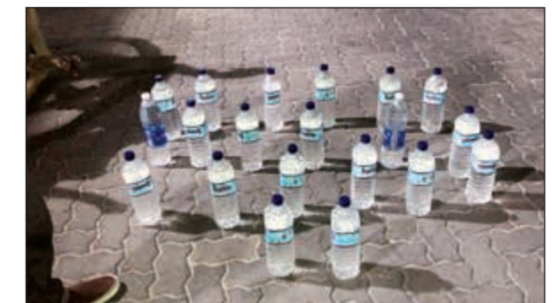
قناني الخمر التي ضبطت مع الآسيوي