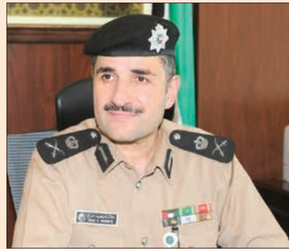
اللواء طلال معرفي

على المنتحقين بعائل للزوجة والأبناء ولكنها ستكون لغيرهم قرابة 300 دينار. وأشار معرفي إلى أن هذه الرسوم المقترحة متواجدة لدى «الفتوى والتشريع» ويمكن القول أنها في مراحلها النهائية للاعتماد. وقال أنه بالتزامن مع هذه الإجراءات والخطوات فإن الإدارة العامة لشؤون الإقامة عاكفة على تعديل اللائحة الخاصة بقانون الأجانب، بحيث تستفتح المجال أمام المرضى للحضور إلى الكوئيت للعلاج في المستشفيات الخاصة بزيارات مرضية كما هو معمول به في المستشفيات شريطة قبول وزارة الصحة وكذلك ستفتح المجال أمام من يرغب في الحضور إلى الكويت كطلاب الراغبين في الالتحاق بالجامعات الكويتية الخاصة، وأن هؤلاء الطلاب سيتمكنون بعد الانتهاء من دراستهم من تحويل إقاماتهم إلى الإقامة عمل في البلاد، كما سيفتح المجال أمام التجار ورجال الأعمال للدخول إلى البلاد بسمات زيارة متكررة لأكثر من مرة، مشيرًا إلى أن