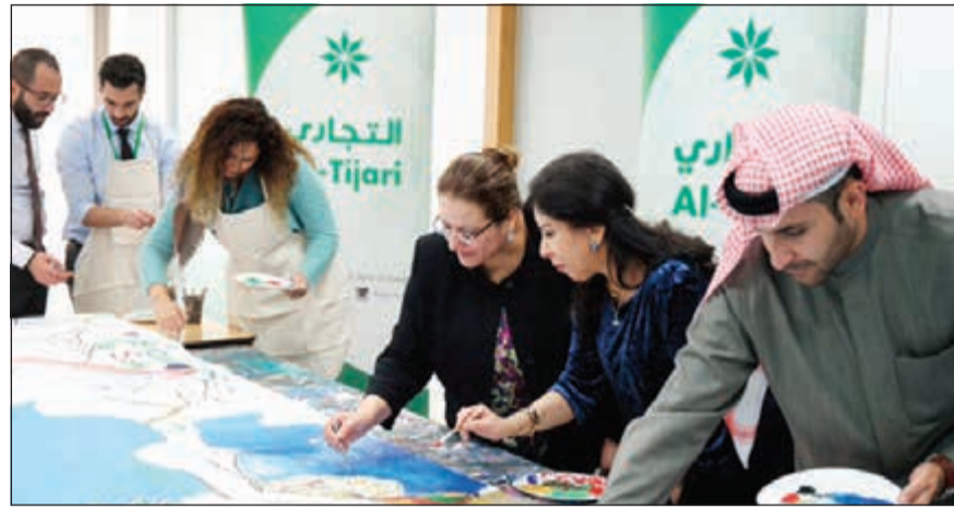
مشاركة بالرسم والتلوين

يعاونون من طيف التوحد وكذلك منظمة «أرت سبيس» التطبيقية في الكويت، بالشكر الجزيل من إدارة البنك التجاري الكويتي مشيداً بالمشاركة اللافتة من موظفي البنك ومتمنين للبنك دوام التقدم والازدهار.