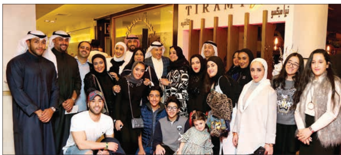
الحضور في لحظة تذكارية خلال افتتاح تيراميسو كافيه في مجمع الصالحية