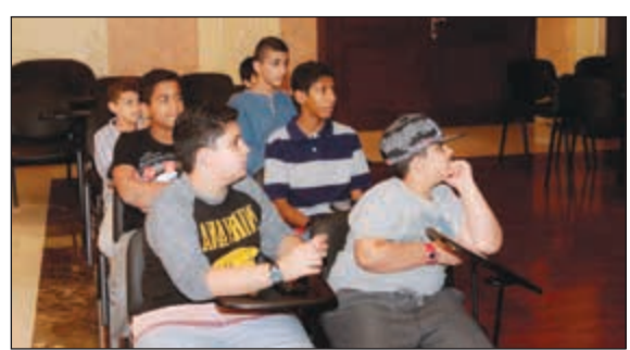
عدد من الطلبة المشاركين