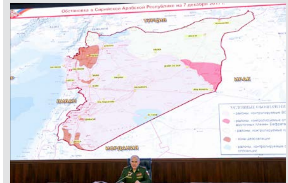
سيرغي روسكوي رئيس إدارة العمليات في الأركان الروسية امام خريطة توضح التطورات في سورية

عواصم - وكالات: أعلنت روسيا أمس تحرير كامل الأراضي السورية من تنظيم داعش وهو ما أعلنت خلاله كل من وزارة الدفاع الأميركية الأميركية الپنتاغون وحكومة النظام السوري. وقال سيرغي روسكوي رئيس إدارة العمليات لدى الأركان العامة الروسية إن الجيش الروسي تمكن من القضاء التام على تنظيم «داعش» وتحرير كل الأراضي السورية منه. وذكر روسكوي في مؤتمر صحفي أمس بأن الطيران الروسي قد نفذ يومياً في المرحلة النهائية من القضاء على «داعش» أكثر من 100 طلعة، ووجه ما لا يقل عن 250 ضربة جوية لعناصر التنظيم ومواقعهم.