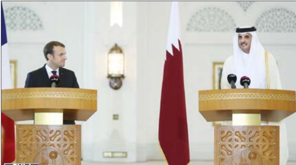
أمير دولة قطر الشيخ تميم بن حمد آل ثاني في مؤتمر صحفي مشترك مع الرئيس الفرنسي إيمانويل ماكرون بالدوحة أمس

لمشاهدة الفيديو يمكن استخدام QR كود أو الـ