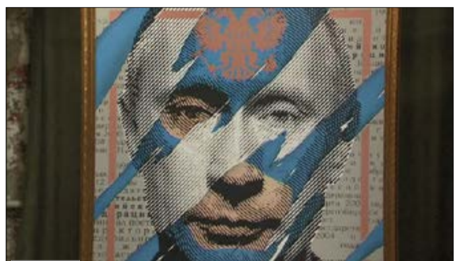
أحد الأعمال الفنية التي تصور الرئيس الروسي فلاديمير بوتين

لمشاهدة الفيديو يمكن استخدام QR كود أو الـ