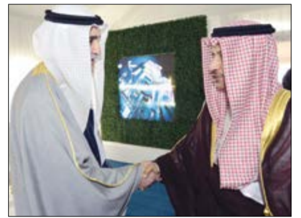
سمو الشيخ جابر المبارك مصافحاً نزار العدساني