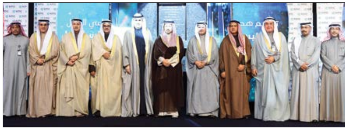
سمو الشيخ جابر المبارك متوسلاً قيادات القطاع النفطي ويبدو م.عصام المرزوق ونزار العدساني وهاشم هاشم وحزمة بخص