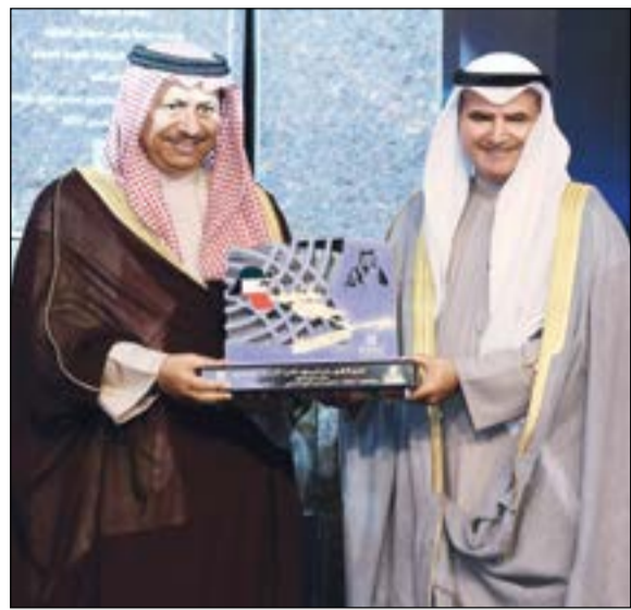
سمو رئيس الوزراء متسلماً درعاً تكريمية من م.عصام المرزوق

آخر أخبار الاقتصاد المحلية والعالمية زوروا موقعنا على www.alanba.com.kw/Business