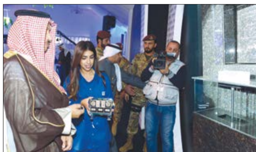
سمو الشيخ جابر المبارك يبدشن مشاريع مجمع الزور النفطي

وأشار إلى حرص «كبيك» على استقطاب خبرة الطاقات الشبابية الكويتية في مختلف التخصصات الفنية والإدارية من موظفي القطاع النفطي إضافة إلى الشباب الكويتي حديثي التخرج، مؤكداً أن العنصر البشري يعد من أهم ركائز نجاح المؤسسات والشركات.