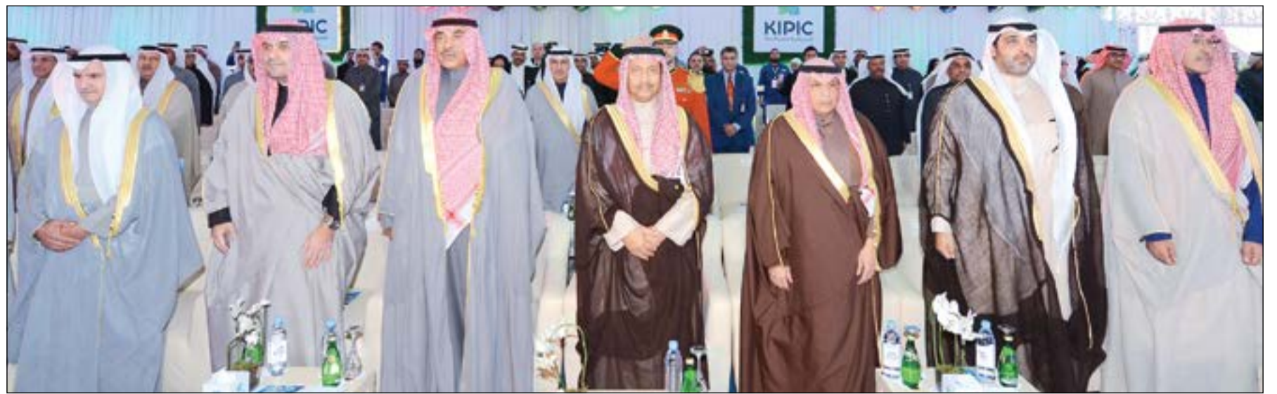
سمو الشيخ جابر المبارك والشيخ صباح الخالد والشيخ خالد الجراح وأنس الصالح والشيخ محمد عبدالله وم.عصام المرزوق والشيخ فواز الخالد في مقدمة الحضور

في حفل ضخم حضره سمو رئيس مجلس الوزراء وعدد من الشيوخ والوزراء وقيادات القطاع النفطي